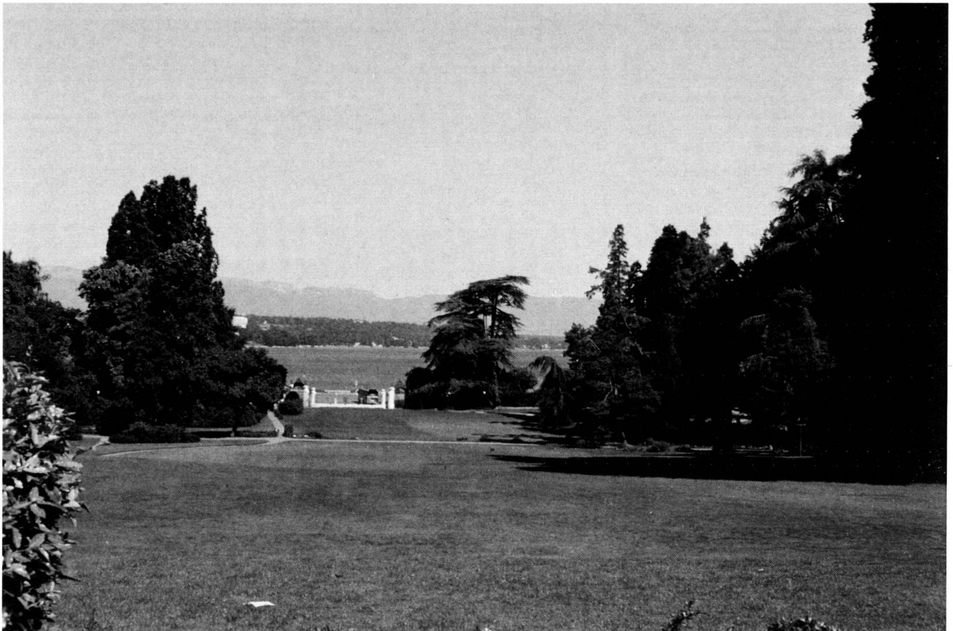
Fig. 1: Parc de la Grange, Geneva, a park city.