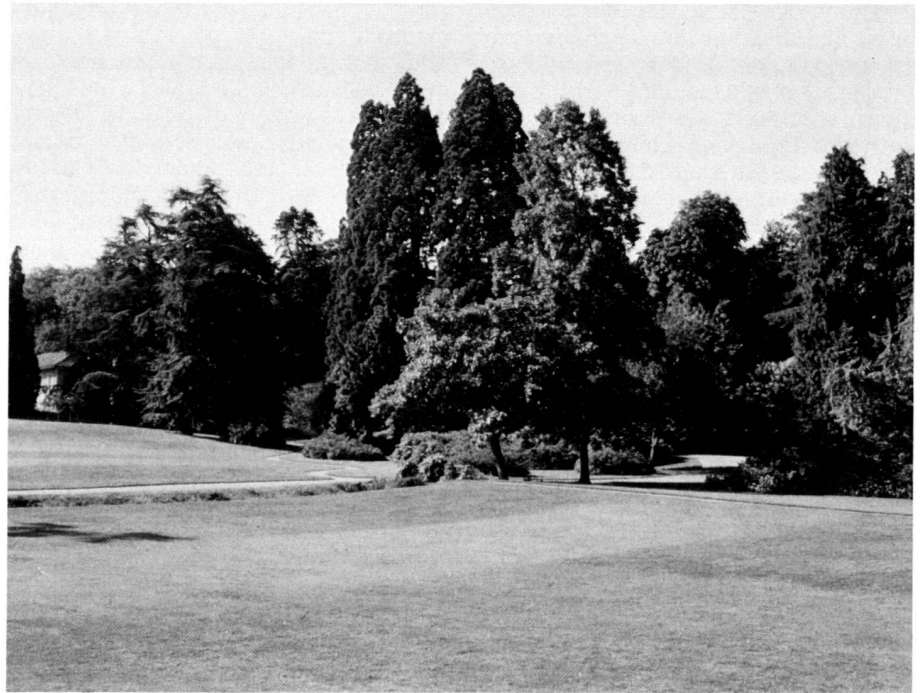
Fig. 2: Parc des Eaux-Vives: Wealth of trees.