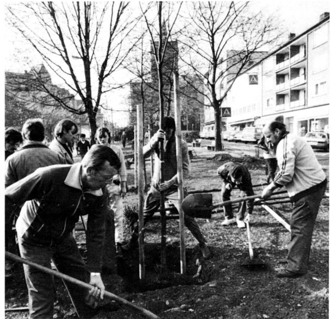
Left: Removing of the asphalt surface by residents in the Diakonissenstrasse prior to the planting of eight plane trees.