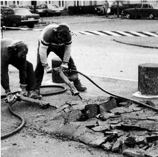
Links: Enttönerungsaktion mit Anwohnern der Diakonissenstrasse zur Pflanzung von acht Platanen.