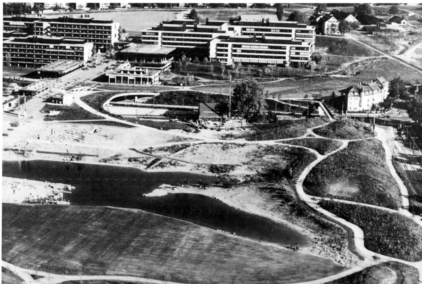
Abb. 1: Luftbild des auf den Abbildungen 2–4 dargestellten Geländeausschnittes der Parkanlage bei der Universität Zürich-Irchel, Zustand 1985 nach Vollendung der Erdbewegungen.

The bases for calculating the volume are either the field data, which are obtained using self-registering tachymeters and converted into three-dimensional coordinates with the help of appropriate programs, or dots and contour lines digitalised from the plan. A program module generates a raster-like digital terrain model (DTM) from this irregular collection of dots by approximating the terrain form in the vicinity of each raster dot by a curved area. By this means the site form is determined mathematically and the height of the raster dot established. The irregular heap of dots is thus transformed into a