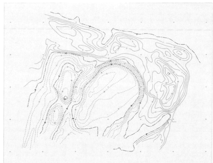
Abb. 4: Differenzmodell (DGM 3): Durchgezogene Linien: Schüttung; gestrichelte Linien: Abtrag; Äquidistanz: 1 m.