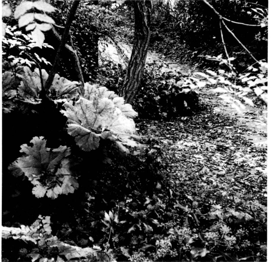
En haut: L'entrée de notre maison est feutrée et généralement ouverte.