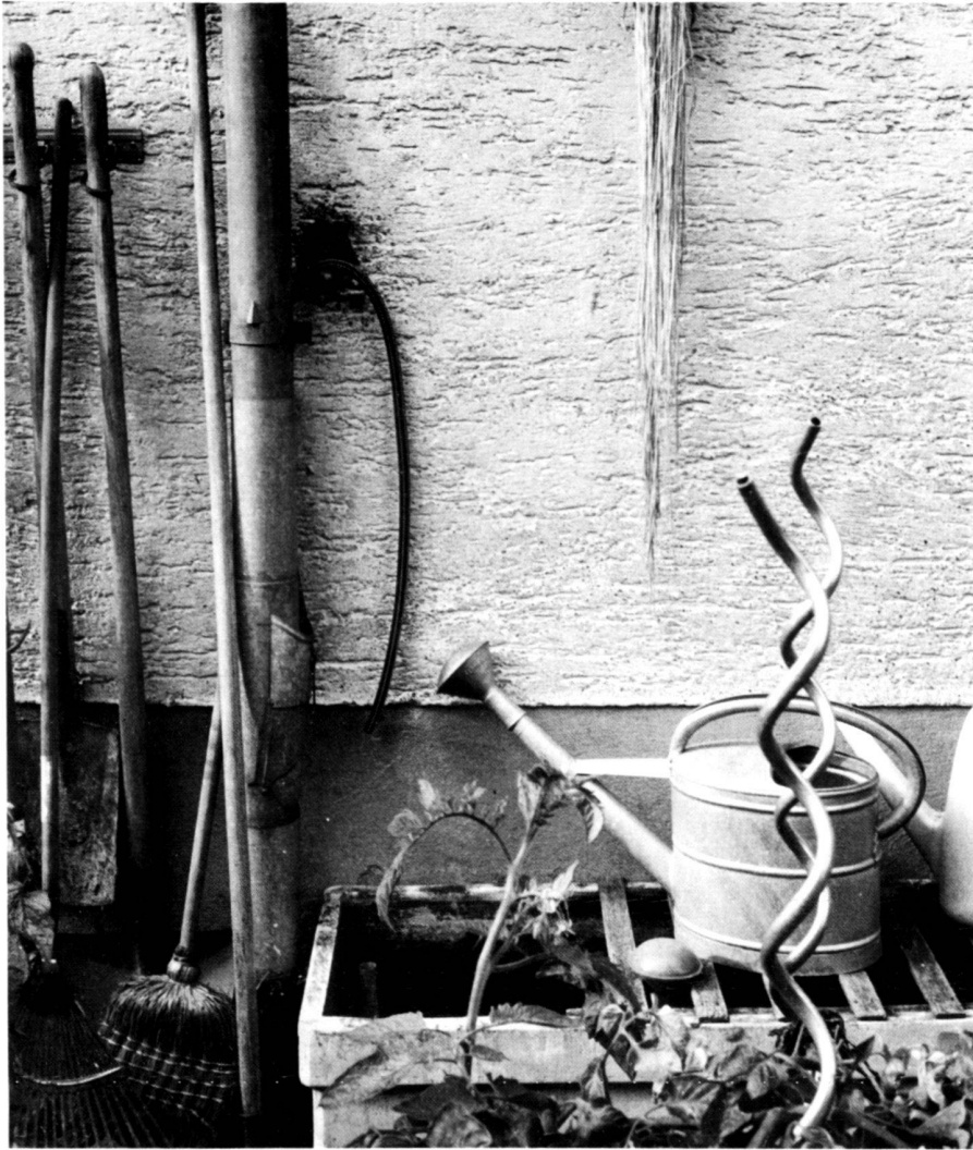
Links: Der Nutzgartenteil und seine Ordnung lassen auf eine gewisse gärtnerische Zeitinvestition unsererseits schliessen.