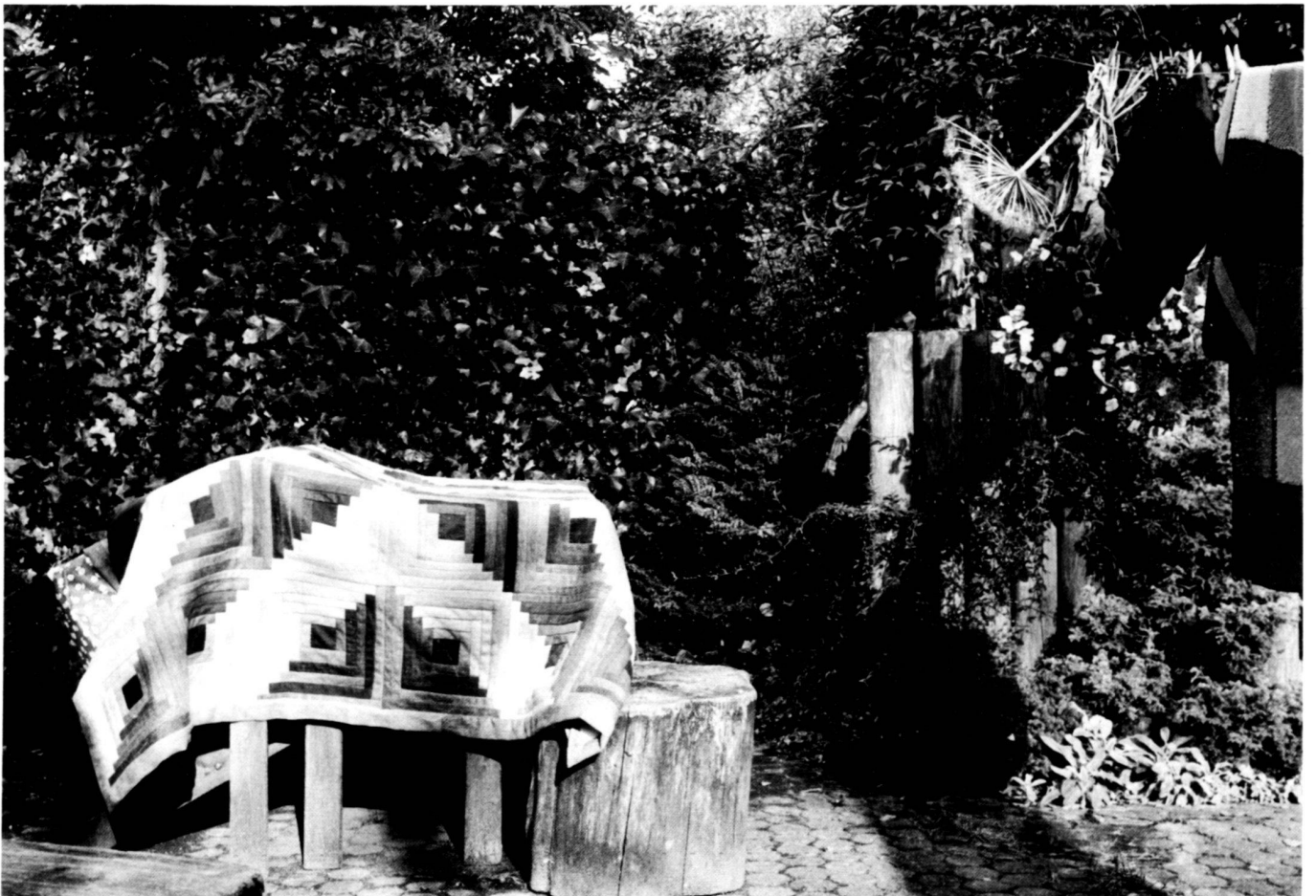
Below: The garden seating area is also used for airing clothes and towels, drying flowers, barbecuing sausages, reading or sunbathing.