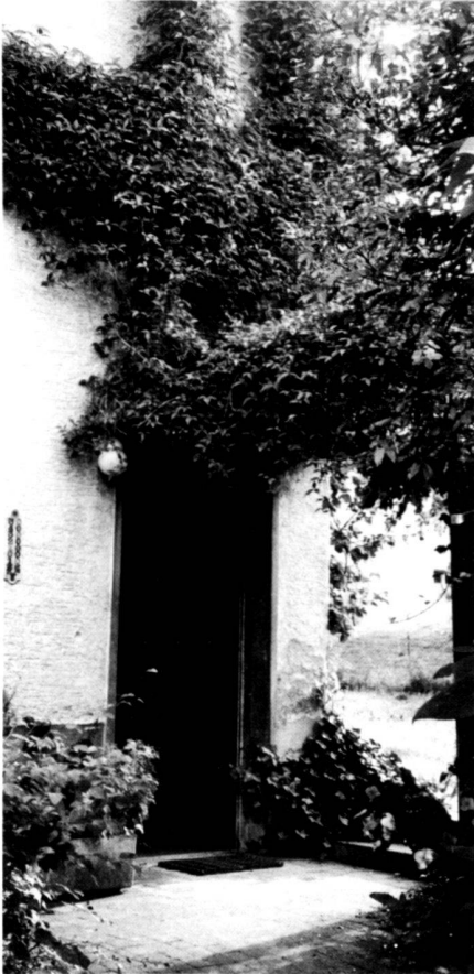
Oben: Unser Hauseingang ist bepelzt und meist offen.