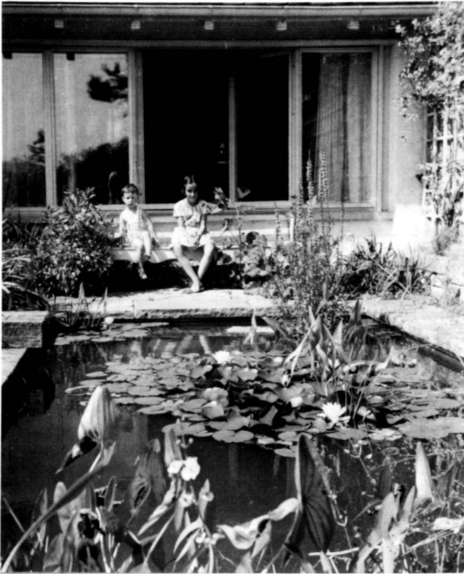
Links: Der zweiten Wohnung vorgelagertes Zierwasserbecken (1956).