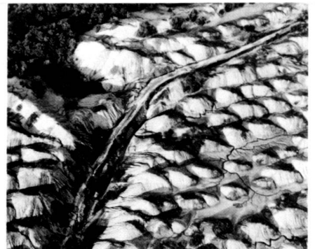
Das Gelände vor der Umgestaltung durch Michael Heizer.

In contrast to Christo, for whom land-art always also means a major operation involving a great deal of fuss, a