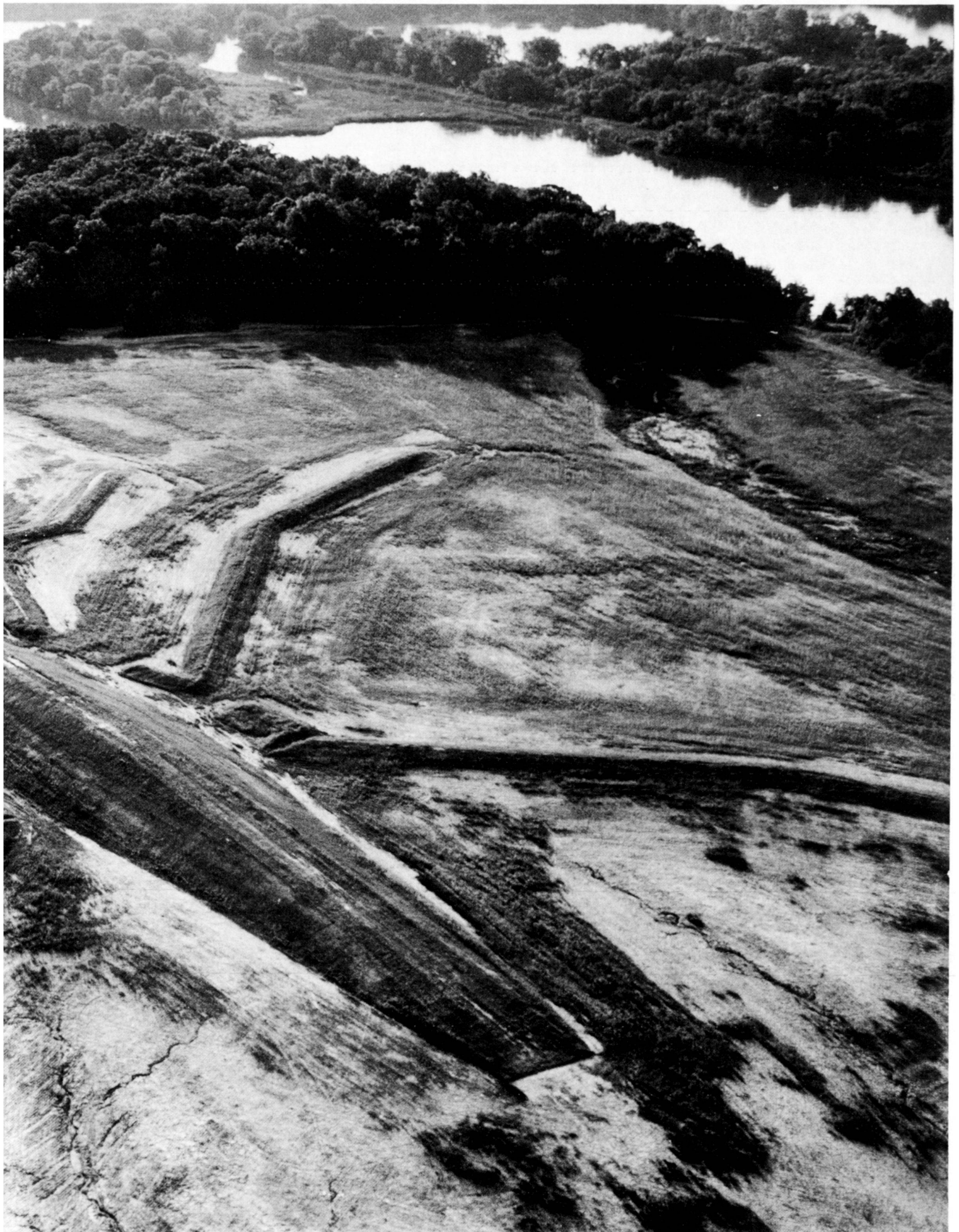
Einer der fünf Bilderhügel von Michael Heizer, die zwischen 1984 und 1986 entstanden sind. Die Hügel liegen bei Ottawa, Illinois.