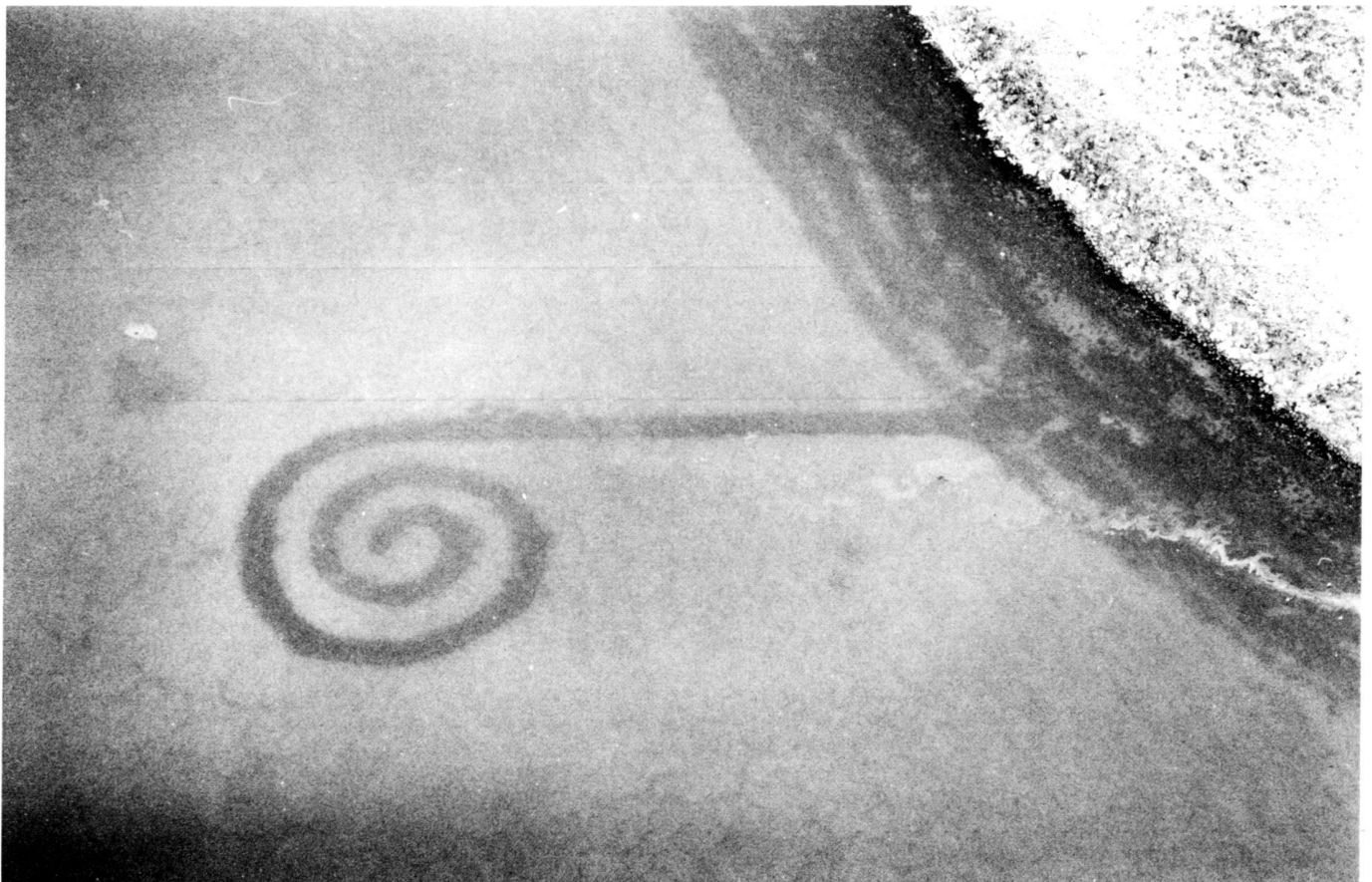
The spiral-shaped jetty by Robert Smithson, created in 1970, now lies about 4 m (13 ft) below water level (see also cover photo).