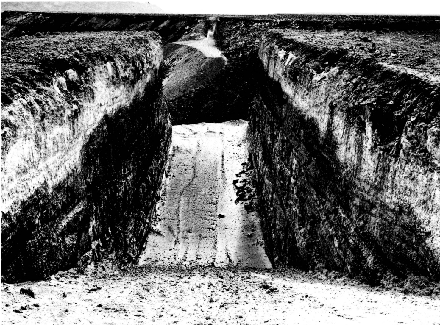
Michael Heizers «Double Negativ».