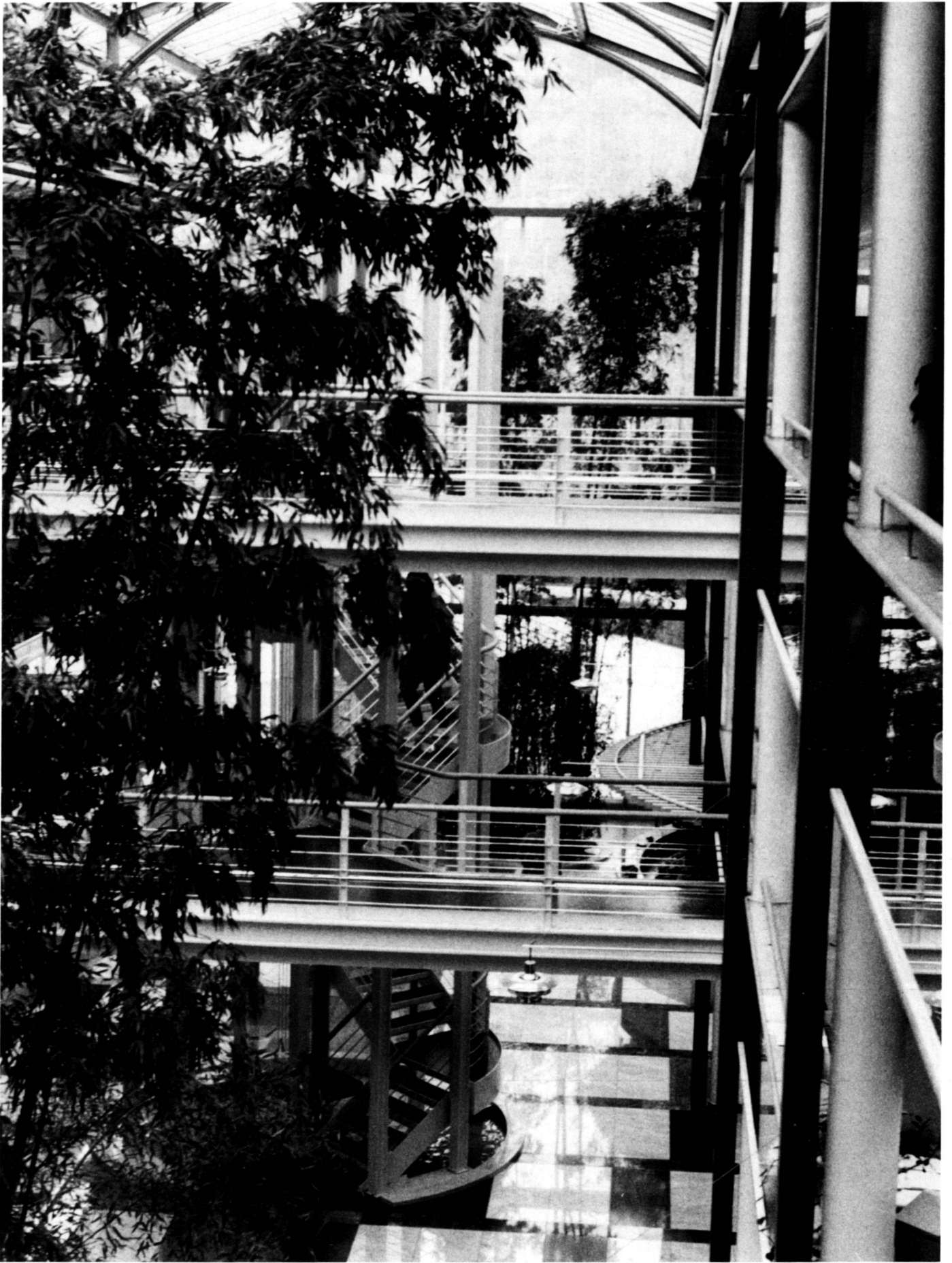
Die zentrale Halle mit den Bambuspflanzen.