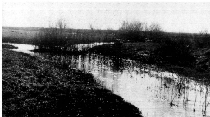
Links: Abb. 2: Bachlauf vor der Regulierung in verästelter Aue.

The incorporation of training walls, groines and invert ramps, the provision of islands, zones of shallow water and old branches, and careful attention to the flora, the water plants, riverside bushes and reeds, as well as the thickets, enrich the features of the habitat in the water and in the water transition zone. The provision of biotope