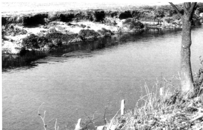
Links: Abb. 6: Der stark beschädigte Flutkanal der Vils 1986.

Given the outline conditions, retroconstruction frequently represents an attempt at returning to nature. Accordingly, the retroconstructed stretch should be observed and, if necessary, promoted in its further development.