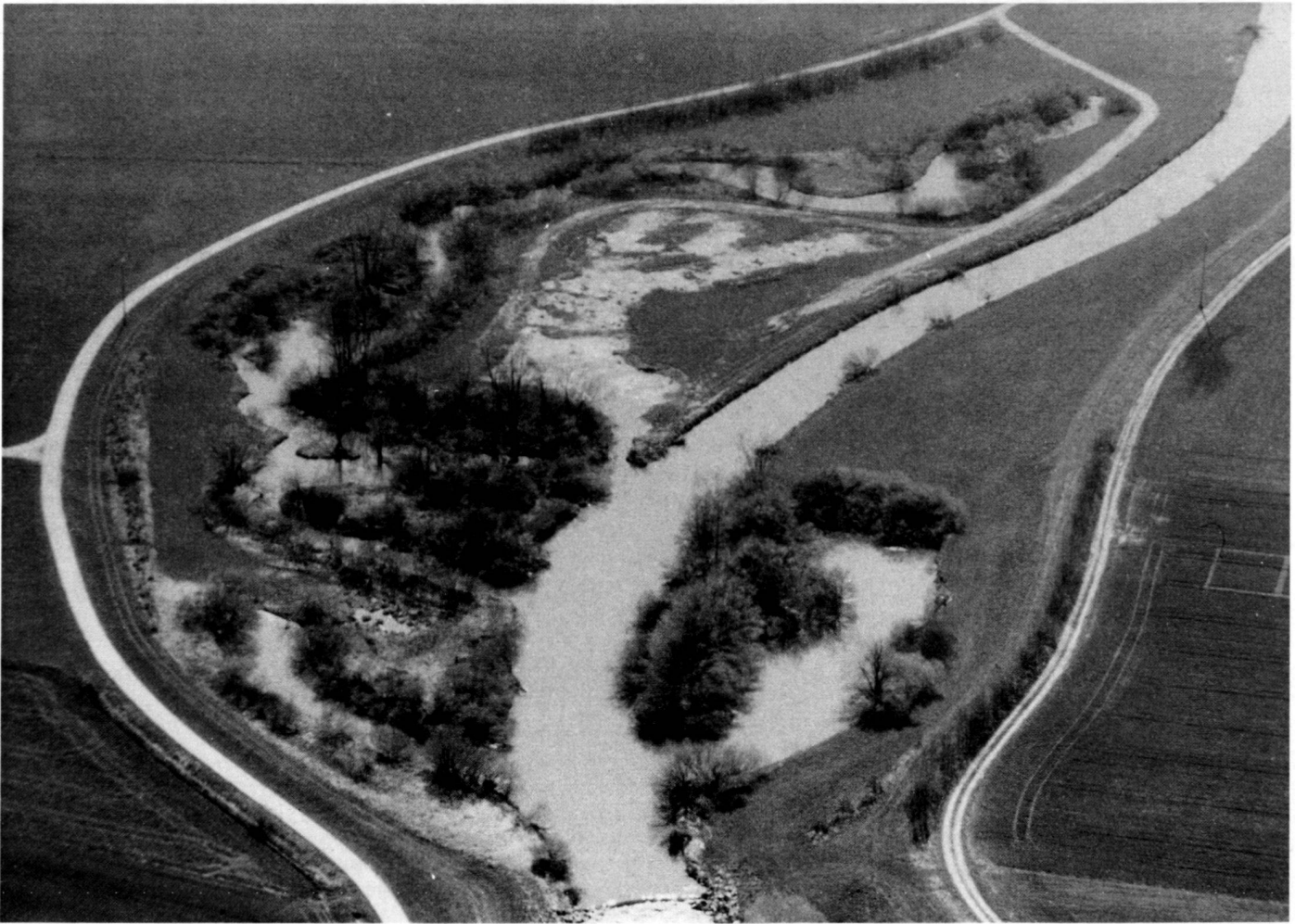
Oben: Abb. 4: Nach Vorgabe des Gewässerpflegeplanes zusätzlich eingebrachte Biotopstrukturen in das Vorland der Vils.