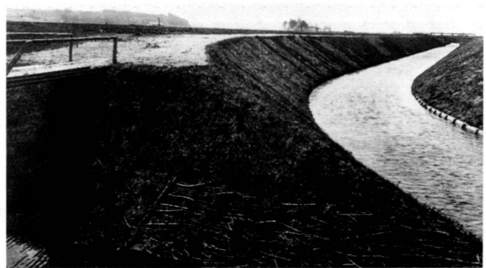
A gauche: Fig. 2: Cours de la rivière avant les travaux de régularisation effectués dans la prairie qu'elle inondait.

Rechts: Abb. 3: Nach der Regulierung. Eine Renaturierung mit Anhebung der Gewässersohle ist ohne Nutzungseinschränkungen in der Aue nicht möglich.