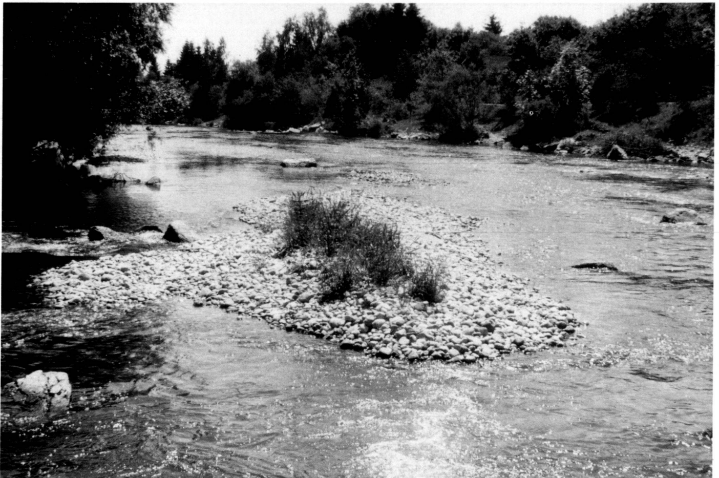
Below: Fig. 5: Revitalised section of the river Mangfall with increased structure range.