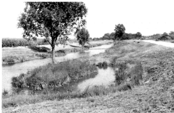
A gauche: Fig. 6: Le cours fortement endommagé de la Vils en 1986.

Rechts: Abb. 7: Flutkanal der Vils 1988. Durch zusätzlichen Grunderwerb konnten die Sohle umgestaltet, die Ufer abgeflacht und damit Voraussetzungen für eine naturnähere Entwicklung eingeleitet werden.