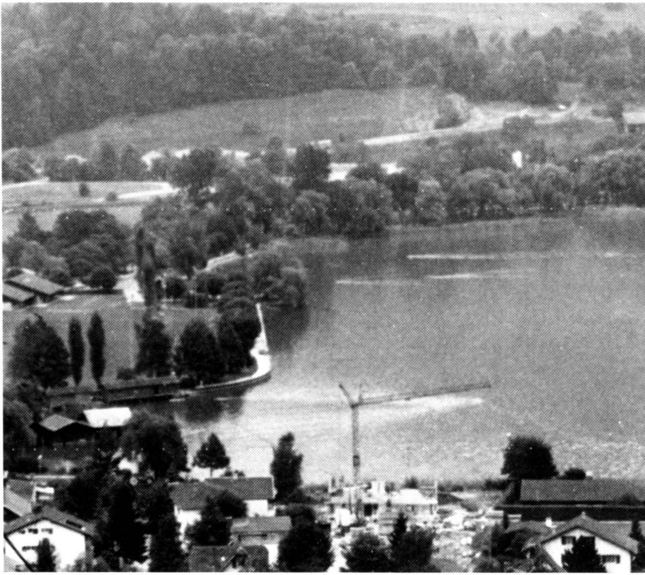
Blick vom Ramersberg auf das Seeufer.