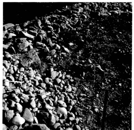
Right: As an extreme addition, type of raw soil for spontaneous development – the stack of stones, the rubble heap. They are varied primary biotopes.