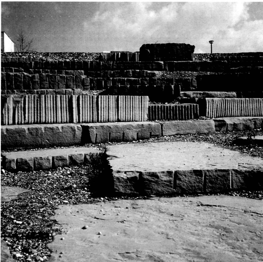
Links: Die Gegenüberstellung: geometrisches Formbewusstsein im vom Menschen dominierten Biotop der Treppenlandschaft.

And what was to be seen in the case of the humans was also taking place in myriad form in the microsector: animals, which had until then been driven out of the city, unexpectedly found niches appealing to them. The park is a primeval situation in the course of awakening, the plant and animal associations are successively colonising the bare ground and rubble heaps. One phenomenon of the new landscape design is becoming apparent: nature is becoming a partner, the developments are open, dynamic and changing . No longer a ready-made product, but a network of habitats.