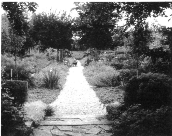
Links: Kitchen Garden.