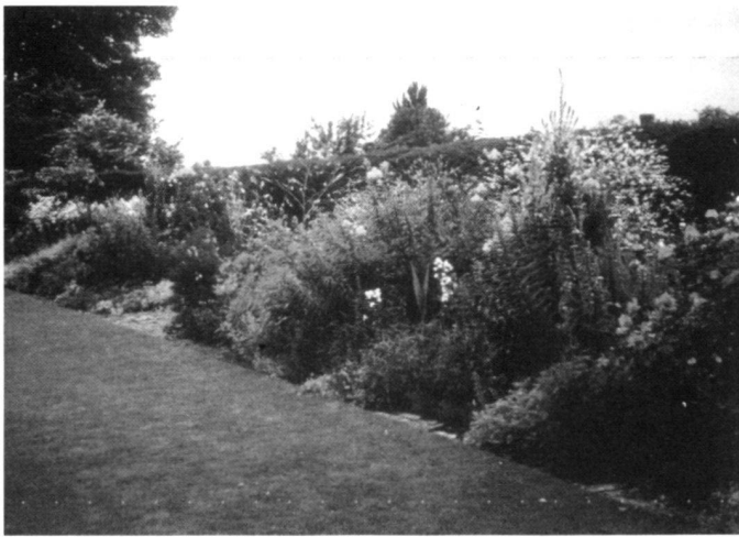
Red and yellow border, Pool Garden.