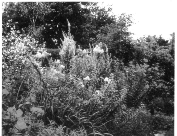
A gauche: Kitchen Garden.