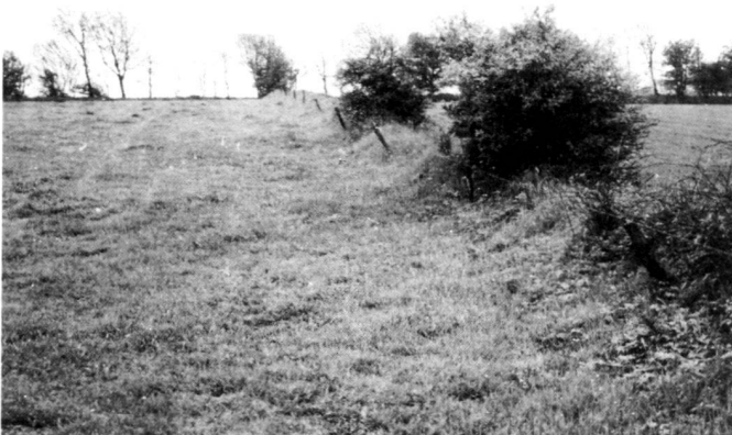
Links: Ohne ausreichenden Schutz vor dem Weidevieh leiden Wallhecken sehr.

A plan was prepared to initially offer a specimen "Meadow Bird Protection" agreement in a limited area (13000 ha). This had been developed by the State Office for Nature Conservation and Landscape Care and was then discussed within the ministerial administration, with the Chamber of Agriculture, the Farmers Association and representatives of local farmers. It underwent many changes in the course of this. But by including agricultural representatives at all levels and, in particular, acknowledgedly successful farmers on the spot, a basis was laid for good acceptance. Wide publicity in the media and finally in personal letters to all the farmers in the area completed the pre-