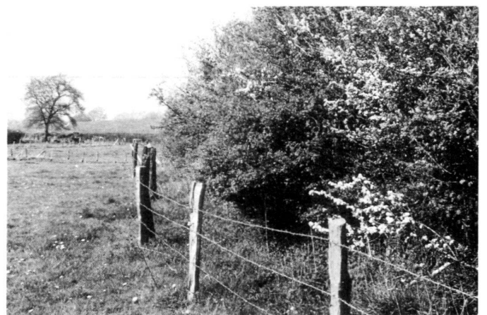
A gauche: Sans une protection suffisante contre le bétail en pâture, les haies souffrent beaucoup.

Rechts: An Extensivierungsflächen müssen neue Zäune in 2,5 m Abstand vom Fuss der Wallhecke gezogen werden.