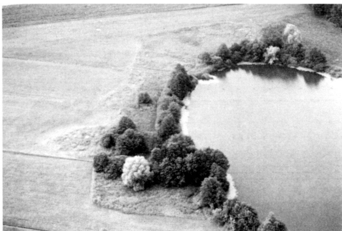
Links: Der Mauensee liegt in intensiv landwirtschaftlich genutztem Gebiet. Die Bewirtschaftung geht bis unmittelbar an das Ufer und die Riedflächen.

Using the map of the existing stock, it has been possible to show that the present ratio of natural elements is 2.5% taking the area as a whole. If all the measures in the field of nature and landscape conservation were to be implemented, this would require approx. 9.5% of the total area. On the basis of a study, M. Broggi and H. Schlegel (1989) suggest an average