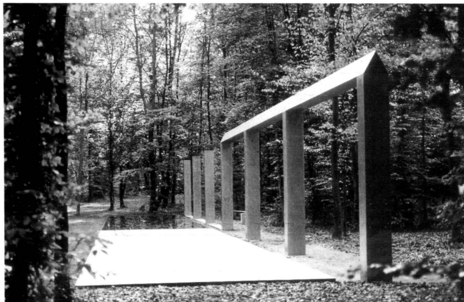
Abb. 5: Gemeinschaftsgrab Waldfriedhof Schaffhausen von Brigitte Stadler und Roland Gut.

rence de notre profession. Si ce fait ne devait pas être dû au hasard, la thèse avancée en introduction, selon laquelle le cimetière est un domaine réservé de l'architecte-paysagiste, devrait bientôt être révisée. Encore faudrait-il, pour échapper à cette perspective, que nous défendions nos sphères propres par un travail de qualité supérieure.