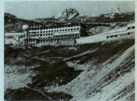
Situation auf Pilatus-Kulm. Stationsareal rechts.

Nach baulichen Massnahmen sind auf Pilatus-Kulm im Stations- und Hotelbereich Erdverschiebungen notwendig geworden. In dieser Höhe – 2000 bis 2060 m – sind solche Eingriffe höchst bedenklich, und die Wunden in der Landschaft werden sich nur mit grosser Mühe – wenn überhaupt – verheilen lassen.