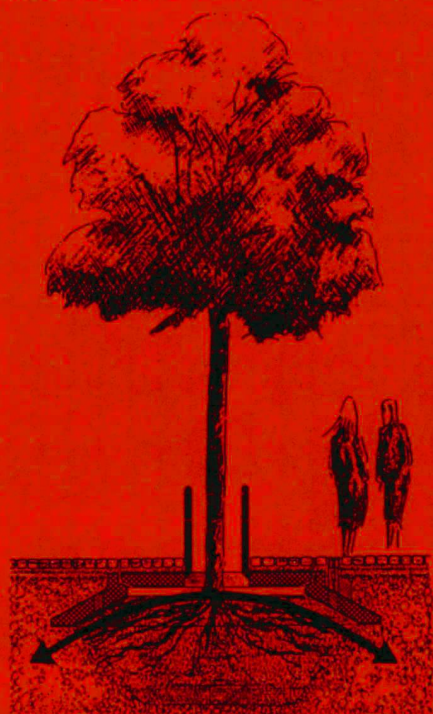
Die Formgebung von «COPAL» ist der Anatomie der Wurzeln angepasst, gemäss den natürlichen Wachstumseigenschaften.

Die Copal-Baumgrubenabdeckung bietet die Möglichkeit, auch bei engen Platzverhältnissen Bäume zu pflanzen. Das System kann «unterflur» oder mit sichtbarer Abdeckung angewendet werden, d. h. bei schmalen Gehwegen. In Wohnstrassen und im Strassenraum kann die Grube überpflästert oder überasphaltiert werden (einheitlicher Belag von Fassade bis Bordstein oder im Strassenraum). Bei der Variante «Unterflur» sorgt eine speziell entwickelte Einlauffrille und zwei Servicestützen für die Bewässerung und Belüftung des Wurzelraumes. Copal gewährleistet bei kleiner Nutzfläche einen grosszügigen unverdichteten Wurzelraum. Die Nutzfläche ist mit 5 t Raddruck belastbar. Formgebung des Elementes sowie die grosse Auflagefläche verhindern Belagssenkungen im Kieskoffer und im Wurzelbereich. Das Copal-Baumgrubenelement ist in kürzester Zeit auf das erstellte Planum direkt ab Lastwagen versetzbar (nur ein Basiselement und 1 Deckelpaar). Ein Betonfundament ist aufgrund der grossen Auflagefläche überflüssig. Das Basiselement wiegt 2500 kg. Das Copal-Baumgrubenelement ist von Landschaftsarchitekten in Zusammenarbeit mit Tiefbauingenieuren entwickelt worden (patentrechtlich geschützt).