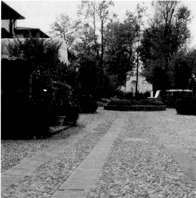
A sinistra: Accesso principale. La nicchia visibile in secondo piano nasconde i tubi per l'impianto di climatizzazione.