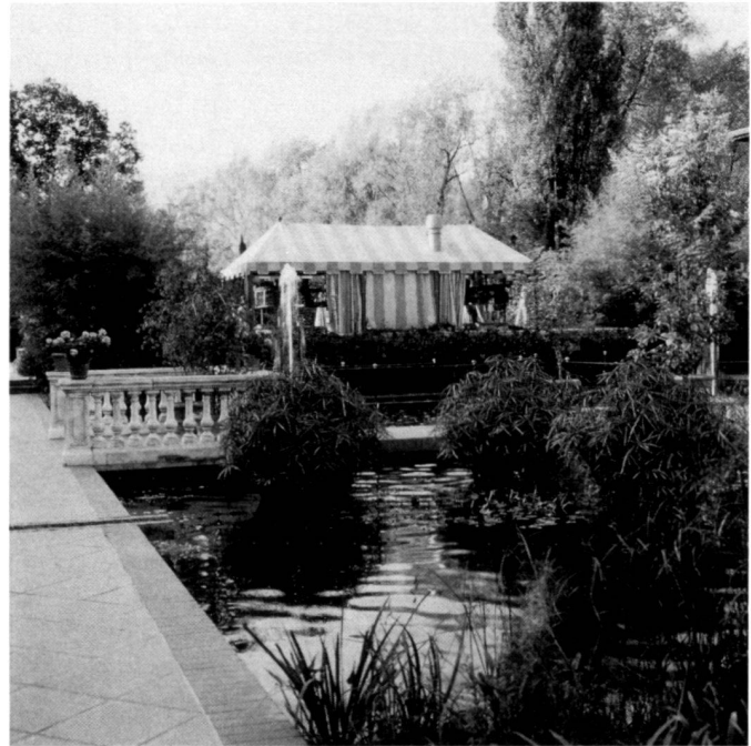
A gauche: Accès principal. La niche au second plan cache les tubes d'aération de la climatisation.