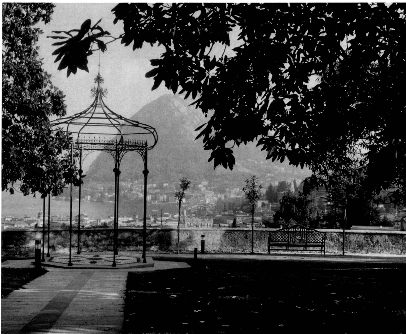
Poetica vista dal vecchio parco verso il golfo di Lugano.

Tentative intéressante de relier deux éléments stylistiques forts, clairement visibles dans l'architecture qui se traduit également dans le jardin.