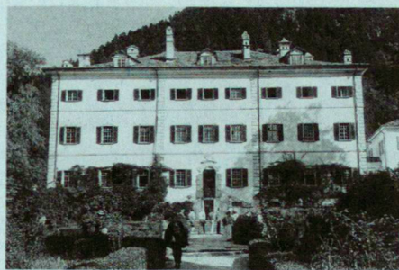
Gartenfront des Palazzo von Salis in Bondo/Bergell.

Und schliesslich – ein Geheimtip übrigens für alle, die das Grossartige nicht nur in der Ferne zu suchen pflegen – die Villa Vertemate in Piuro