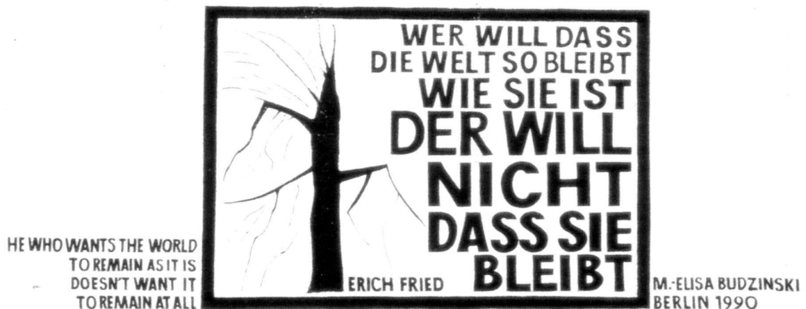
«East Side Gallery» an der Berliner Mauer.