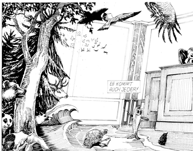
«J'aimerais me plaindre auprès de vous, Monsieur le Juge!» «Chacun pourrait le faire!» «Et chacun le fait!»