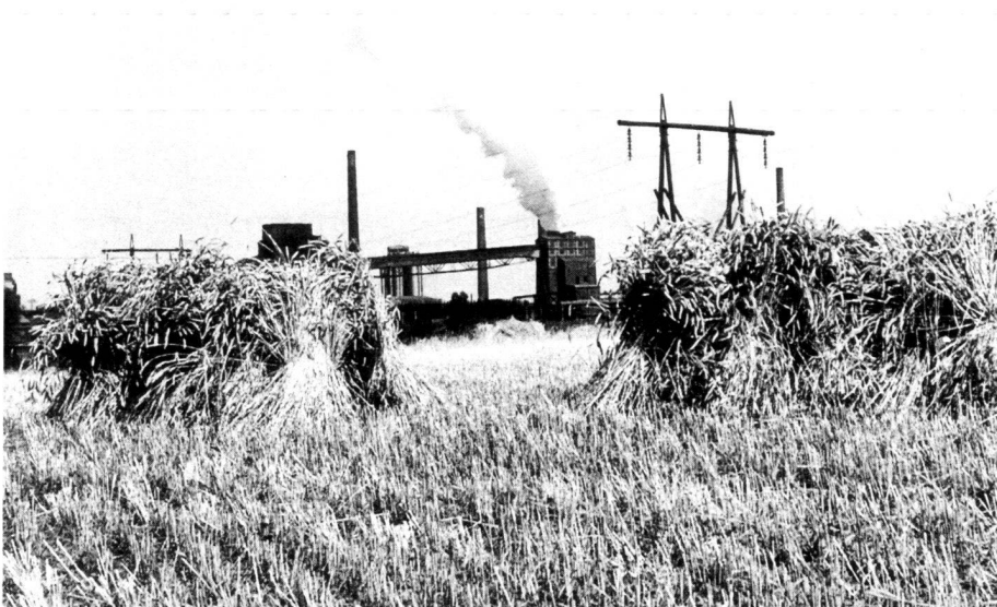
Links, Abb. 2: Das Landschaftsbild als Nebenprodukt von Nutzungen: gestalthafter Ausdruck der Disharmonie zwischen Nutzungsarten und des Widerspruchs von Natur und Kultur.

But when looking for a champion for natural beauty in civilisation and the landscape and cultural historical dimension specifically suitable for a site, the landscape architect offers the most convincing approach: not a single discipline examination of the environment, but a linking together of all environmental problems in their spatial relationship and individual site requirements. He is, it is true, closer to nature than other professions, at the same time, through his knowledge of the interaction of animate and inanimate nature, he is protected from a diffuse mystical way of considering nature or a less comprehensible romantic rapture for nature than any city dweller suffering from withdrawal from nature. The landscape architect is also not part of a section of