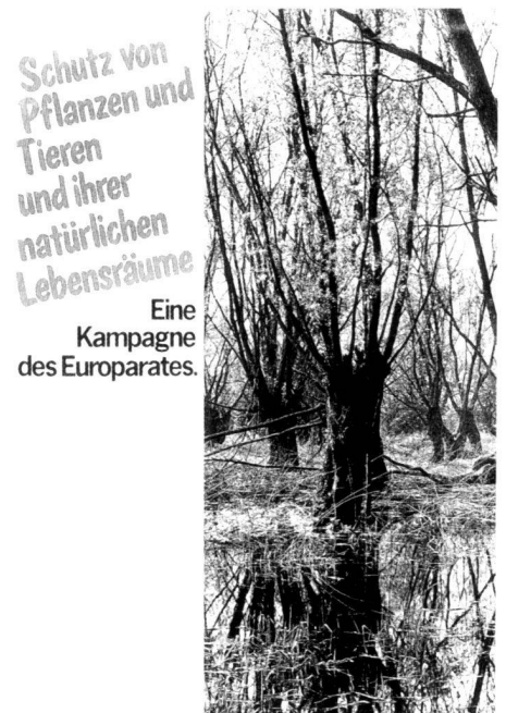
A droite, ill. 3: La teneur esthétique fondamentale de la nature digne d'être protégée dans le potentiel d'images du paysage naturel: affiche du Conseil de l'Europe.

Schutz von Pflanzen und Tieren und ihrer natürlichen Lebensräume Eine Kampagne des Europarates.