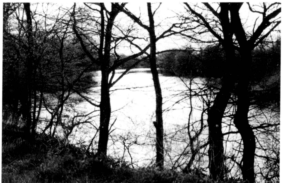
Die Muldenaue, ein bestehendes Naturreservat. La «Muldenaue», une réserve naturelle existante. The water meadow in a hollow, an existing nature reserve.

The result of the infinitely laborious work lying before us will not be the «original state» of the landscape before open-cast mining. Rather, we are endeavouring to read the traces of the past and thus to again achieve a functioning landscape as a basis of life for human beings.