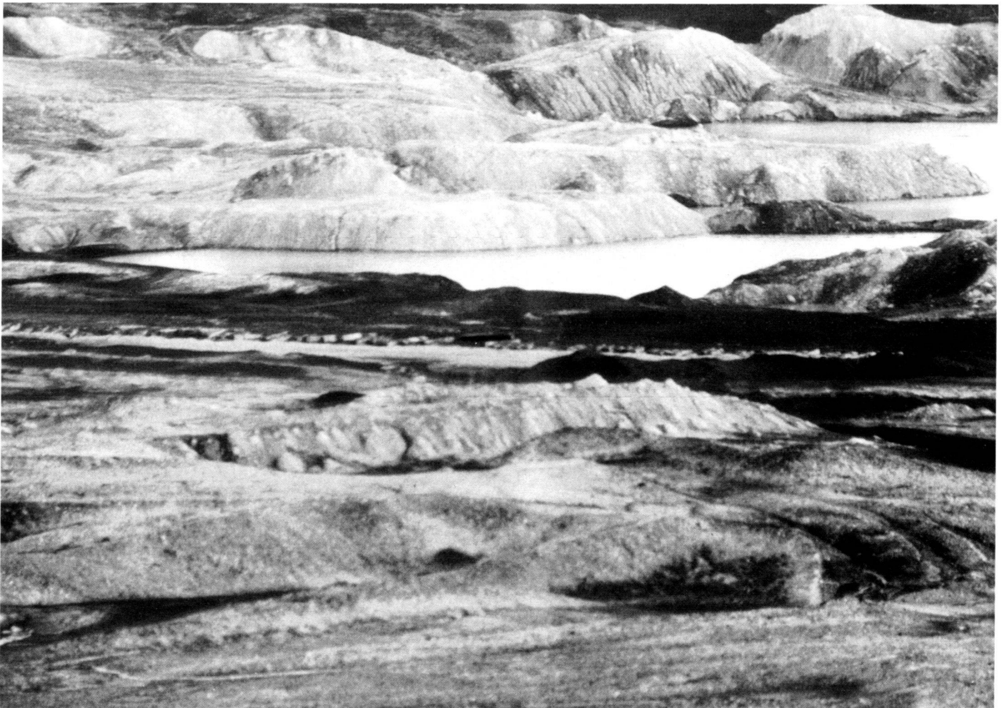
Tagebau – Mondlandschaft «Goitsche».

Villages, such as Seelhausen, no longer exist, Werbelin is a ghost village, the demolition bulldozers have begun their