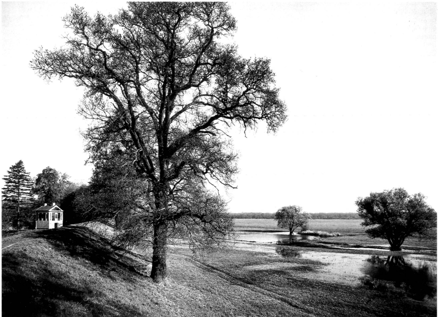
Wörlitzer Park – Wallwachhaus mit Elbwiesen.

This industrialisation process reformed, but also retained extensive natural landscape areas, such as the Dessau-Wörlitz Garden Kingdom, that major park landscape of the Age of the Enlightenment in the 18th century, or the watermeadow landscapes of the Mulde and Elbe, which have now for the most part been brought together in the UNESCO biosphere reserve Middle Elbe and listed for protection.