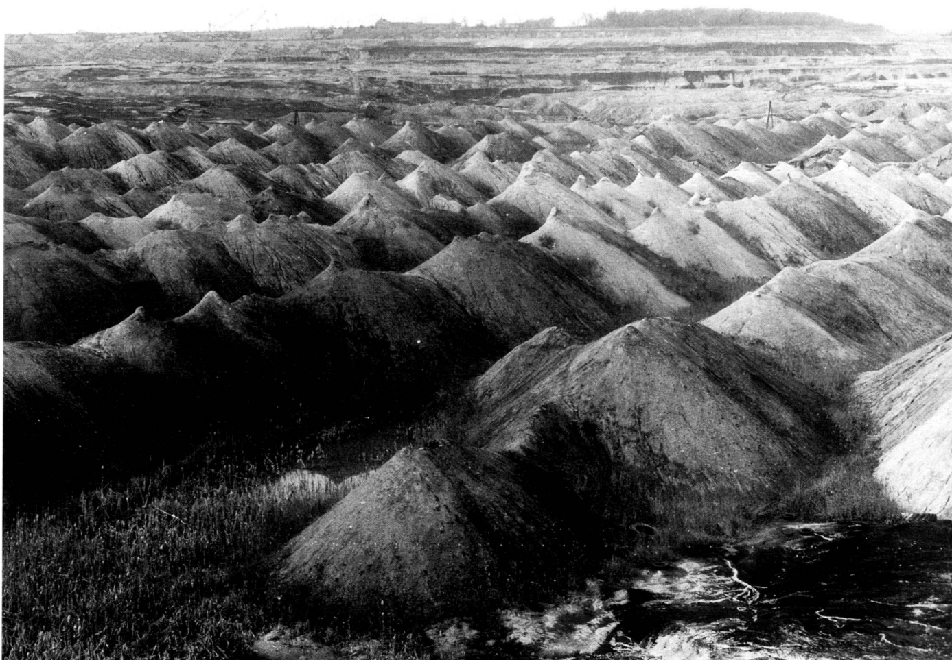
Braunkohlebrache – Grube Goitsche bei Bitterfeld.

– the political culture, still just at its first beginnings, in which a democratic and public discourse on models and perspectives for the regional renewal can develop,