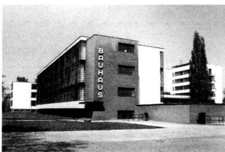
Bauhausgebäude in Dessau. Bâtiment en style Bauhaus à Dessau. Bauhaus building in Dessau.

The old industrial region along the Mulde and Elbe between Wittenberg, Dessau and Bitterfeld has vast and undiscovered, catastrophic and surprisingly beautiful open spaces. The history of their creation and their present appearance makes the modernisation process for this landscape comprehensible. Tracing this history with its in part forgotten or decomposed cultural deposits, making people aware of it again and publicising it is a task which architects, urban planners, landscape architects, cultural specialists and art experts at the Bauhaus Dessau have set themselves under the title “Industrial Garden Kingdom” (Bodenschatz, H. et al., 1991). The area around Dessau-Bitterfeld only began to develop into a major economic