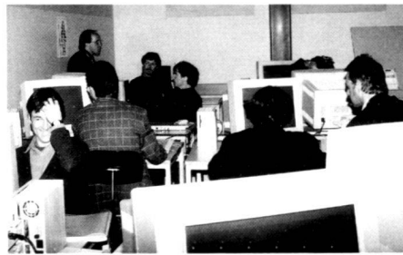
EDV-Weiterbildungskurs für Berufstätige.