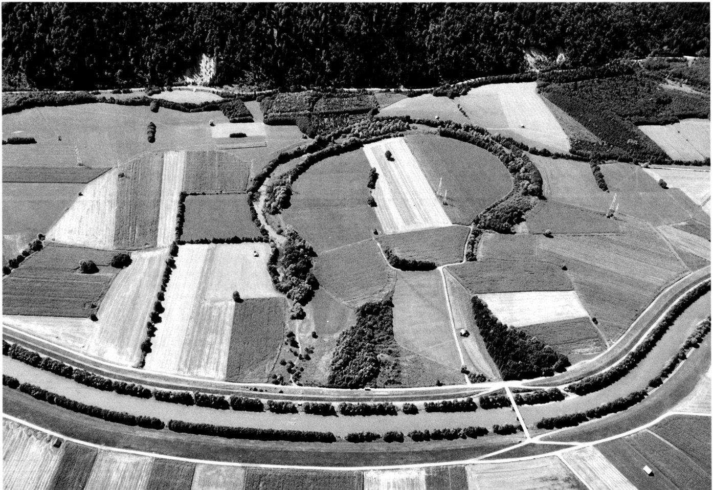
Regulierung und intensive landwirtschaftliche Nutzung haben die ehemals ausgedehnten Auwälder in diesem Abschnitt der Gail (Kärnten) weitgehend verdrängt. Der verbliebene Altarm lässt das einstige Ausmass erahnen.

Care for a stretch of water thus serves for flood protection, maintaining the stretch of water as a habitat and safeguarding and restoring the ecological functional ability of the stretch of flowing water in each case.