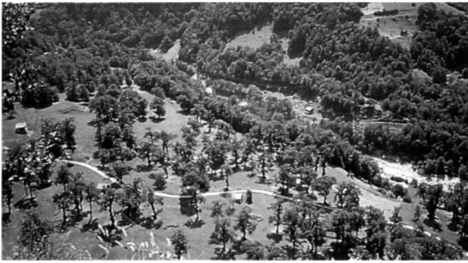
...Sicherung und Gestaltung von Erholungsräumen und schönen Landschaften.