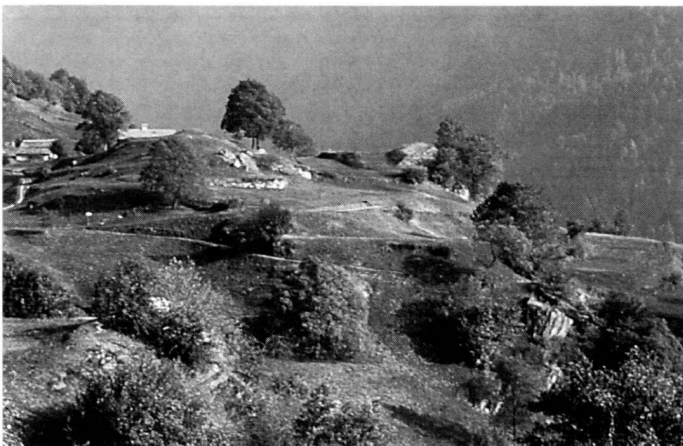
...Kulturlandsicherung, Strukturierung, ökologische und ästhetische Aufwertung.