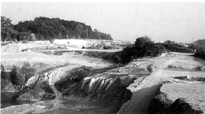
...Eingriffsbeurteilung, Ausgleichs- und Ersatzmassnahmen, häuslicher Umgang mit Ressourcen.

To sum up, the following postulates can be put forward: