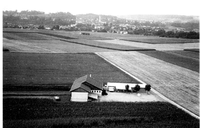
...préservation des paysages de culture, conservation des structures, revalorisation écologique et esthétique.