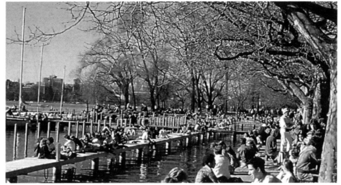
...préservation et aménagement d'espaces récréatifs et de paysages de beauté.