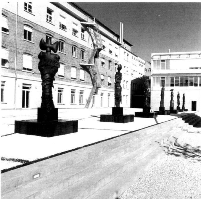
Links: Terrassenkante mit Keramikmuseen von Elisabeth Langsch, Zürich.

A central marl-surfaced area "covered" by umbrella-like plane trees mediates between the various users and buildings. The open space produced beneath the leafed roof creates a world of its own, unmistakable and utilisable in a variety of ways. The leafed roof prevents people in the surrounding buildings from looking in. The listed dwelling house in the forest of leaves is used for services for students. In contrast to the shady and semi-shady courtyard with its plane trees we have the sunny terrace, the raised roof of the covered car park in front of the Länggasse complex, the outside area of the cafeteria. On the edge of the terrace stand monumental, coloured ceramic figures by the Zürich artist Elisabeth Langsch which define the area of the terrace without dividing it. The basic attitude of the generous and simple treatment was also continued in the other open spaces: the climbing plant courtyard, bamboo courtyard and courtyard patios are each laid out with one species of plant, as well as the pruned hedges in the peripheral parts of the grounds.