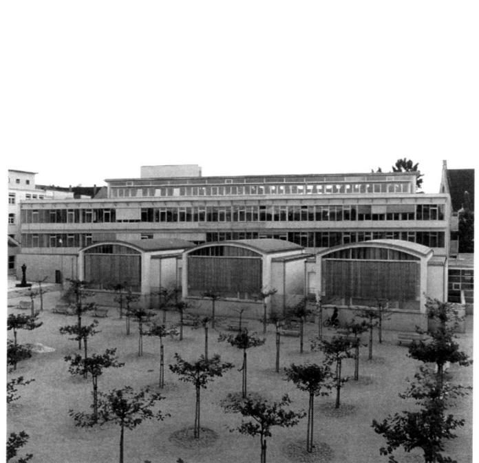
Left: Terrace boundary with ceramics muses by Elisabeth Langsch, Zurich.