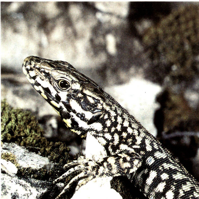
Bedrohte Tierarten finden neue Lebensräume in der Stadt, links Mauereidechse, rechts Fledermaus.

The town may be considered as a mosaic of mineralised zones (roads, dwellings) entangled with non-built-up open spaces (gaps between buildings, green open spaces, embankments, etc.). Urban vegetation is characterised by the occupation