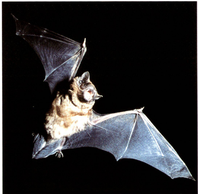
Des espèces animales menacées trouvent de nouveaux biotopes en ville, à gauche l'hermine, à droite la chauve-souris.