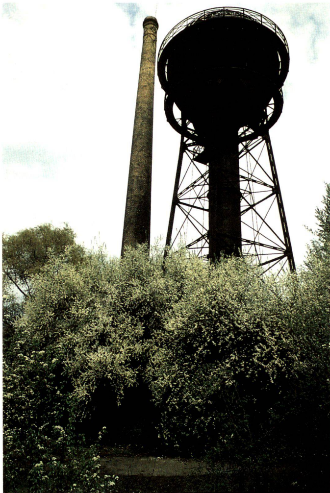
Steinweichsel ( Prunus mahaleb ) wächst bestandsbildend auf dem Anhalter Güterbahnhof in Berlin-Kreuzberg. Diese submediterrane verbreitete Art kommt hier weit ausserhalb ihres natürlichen Areal auf Bahnschotter und auf Trümmerschutt vor, 1983.

"Ecological" or perhaps better "environmentally sustainable" urban development must be seen as a permanent process in which the ecological, spatial and social objectives are coordinated with one another on an equal footing. Urban planning only deserves the attribute "ecological" if the following basic principles of ecological planning are taken into account: