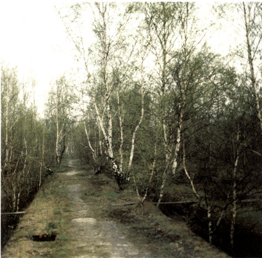
Sandbirken ( Betula pendula ) sind die häufigsten spontan aufwachsenden Bäume auf städtischen Freiflächen, hier auf aufgelassenem Bahngelände in Berlin-Kreuzberg, Anhalter Bahnhof, 1983.

Les bouleaux ( Betula pendula ) sont les arbres les plus courants que l'on rencontre naturellement dans les espaces libres urbains, ici sur les emprises du chemin de fer à Berlin-Kreuzberg, Anhalter Bahnhof, 1983.