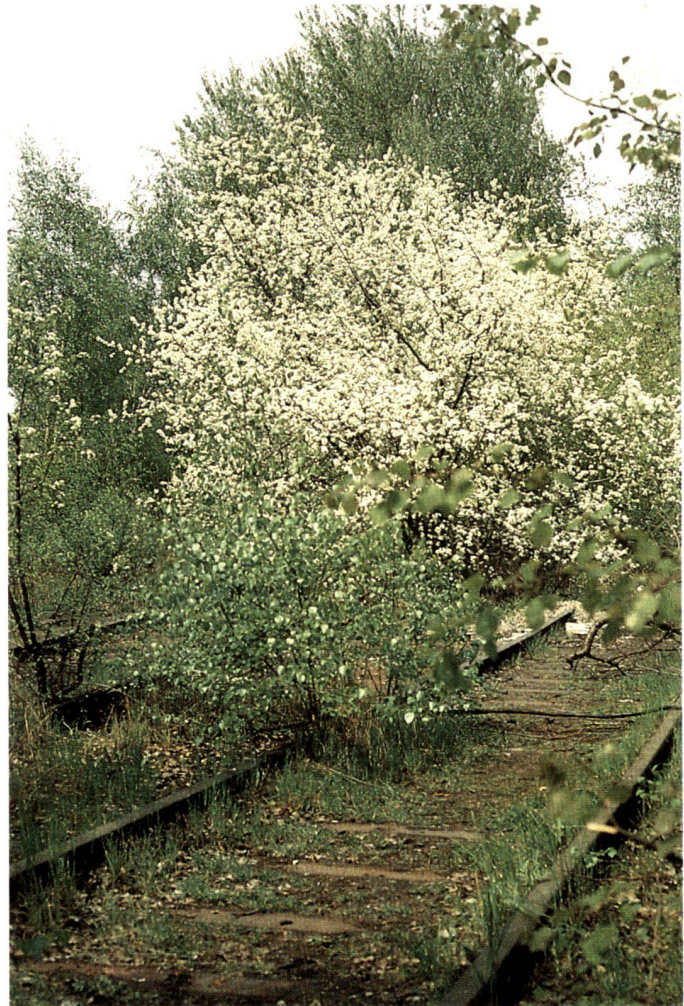
Un prunier ( Prunus mahaleb ) se développe à la gare des marchandises Anhalter de Berlin-Kreuzberg. Cette espèce répandue dans les zones sous-méditerranéennes apparaît ici sur le ballast et les décombres, éloignée de son aire naturelle, 1983.