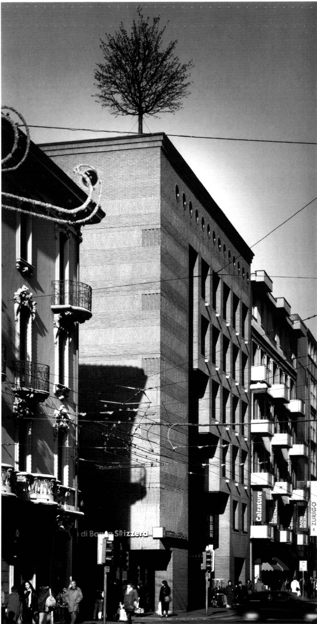
Verwaltungsgebäude Ransila in Lugano.

Bâtiment administratif Ransila à Lugano.