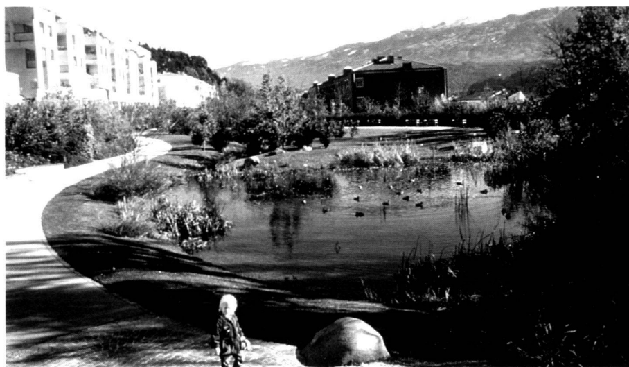
Vernetzende Grünschnitten im Zuge von Wohnbauten sichern Freiräume und ökologische Korridore.

We in public green area administrative departments have to face particular challenges in economically difficult times to take account of ecological links, to plan and manage efficiently and to point out the non-restorable importance of natural urban areas. Because only a city with open spaces is a living and attractive city.