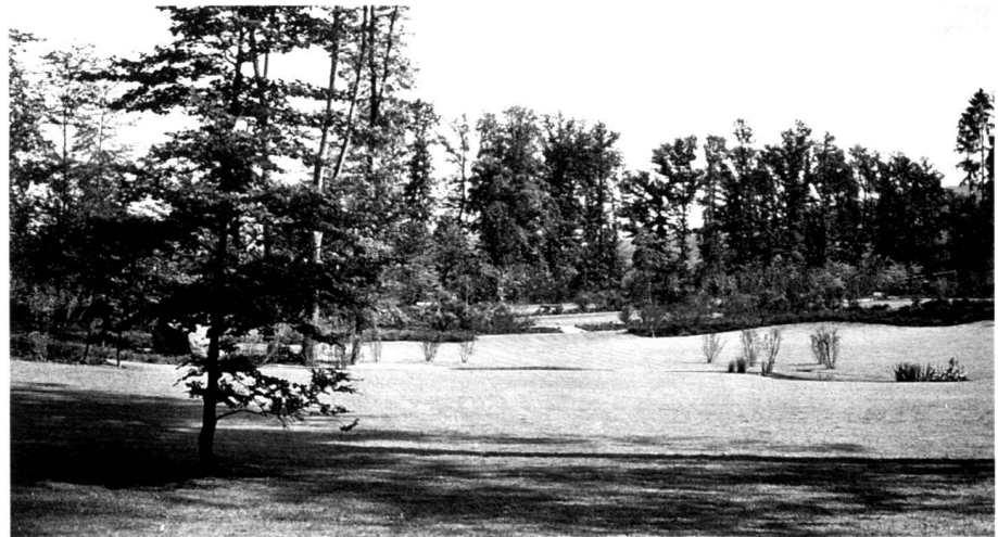
Photo dating from the fifties: view of the park meadow, an area of green open space with pool. The graves arranged in rows for coffin burials in the sixties have been removed.

Luftaufnahme 1991: Der durch die Alleen klar strukturierte alte Friedhofsteil aus den Jahren 1878 bis 1935 wurde in den fünfziger Jahren von Landschaftsarchitekt Franz Vogel sen. im Stil des modernen landschaftlichen Gartens erweitert.