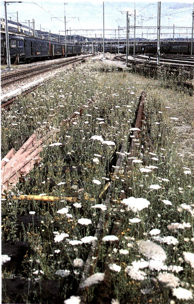
Links: Wilde Möhre (Daucus carota).