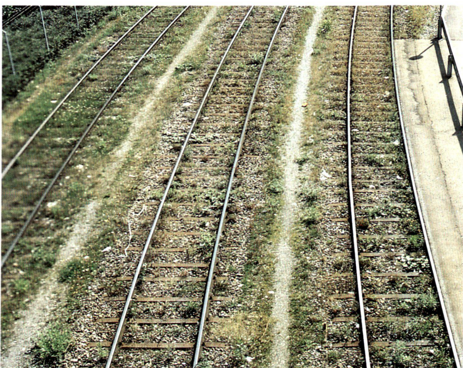
Geleiseunterhalt mit ( oben ) und ohne Herbizide ( unten ).

Entretien des voies avec ( en haut ) et sans ( en bas ) herbicide.