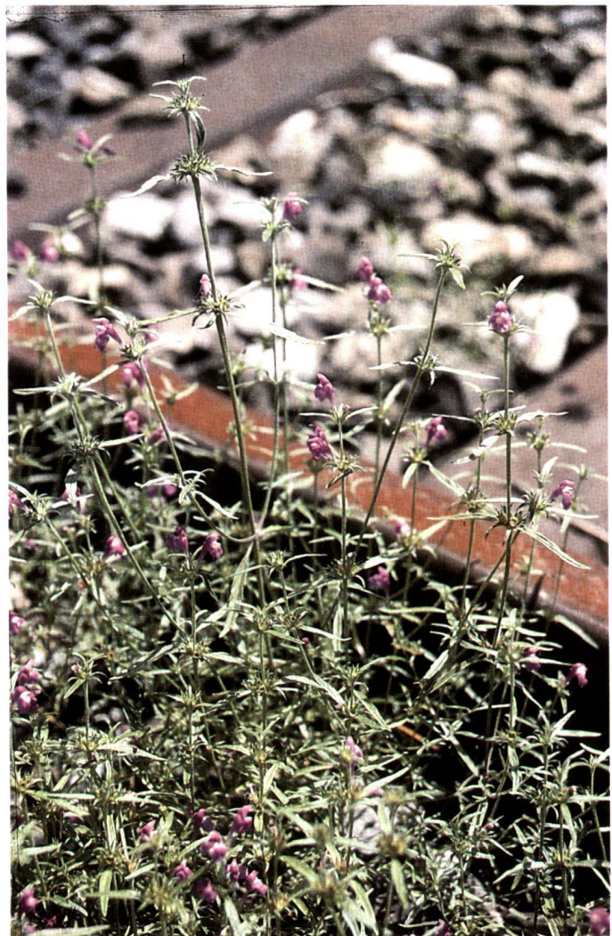
Left: Wild carrot (Daucus carota).

Rechts: Schmalblättriger Hohlzahn (Galeopsis angustifolia), Art der Roten Liste.