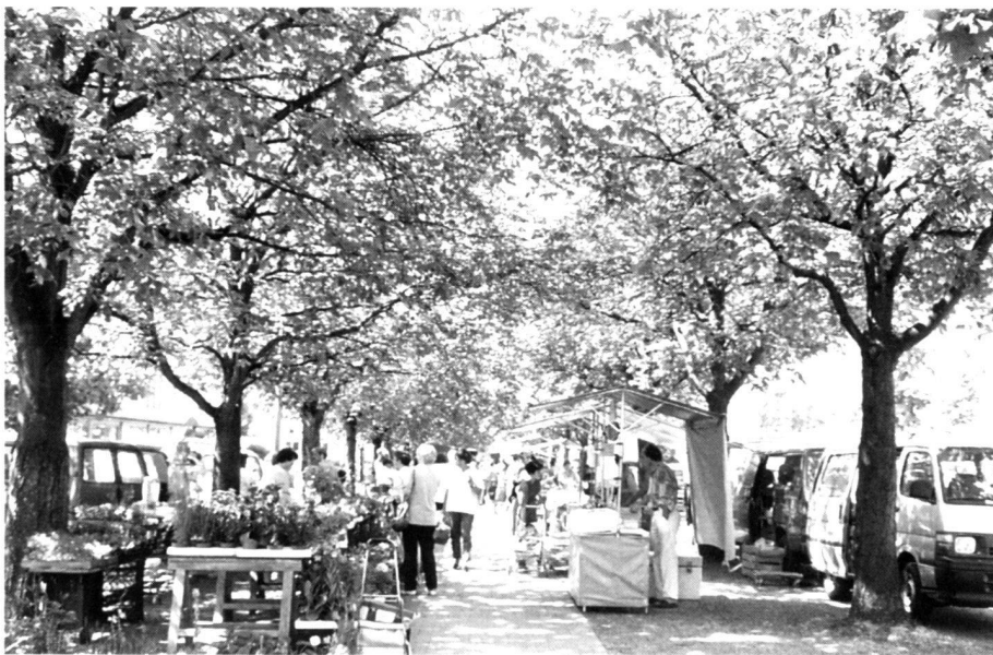
40-jährige Aesculus × carnea «Briotii» mit einer Höhe von 8 bis 10 Metern, welche einen minimalen Pflegeaufwand verursachen (links).

Werden auf Köpfe zurückgeschnittene Bäume wachsgelassen, bilden sich anstelle der Köpfe besondere Strukturen, die zeit ihres Lebens sichtbar bleiben (rechts).