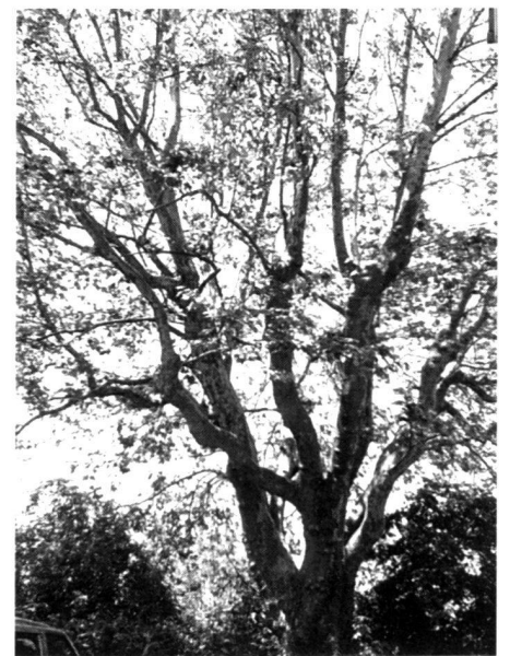
40-year-old Aesculus × carnea "Briotii" with a height of 8 to 10 metres which require a minimum of effort for care (left).

If trees which have been pruned back to their heads are allowed to grow again, specific structures are formed instead of the heads which remain visible for the rest of their life (right).