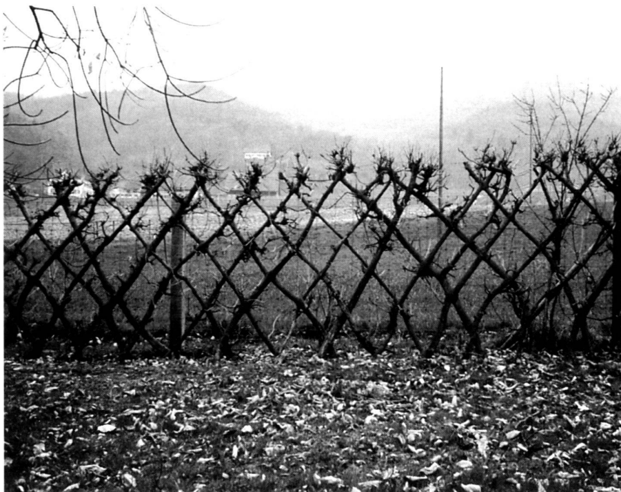
Kunstvoll geformte Hecke, welche trotz geringer Breite eine optimale Abgrenzung bildet.

The situation is somewhat different if arti-