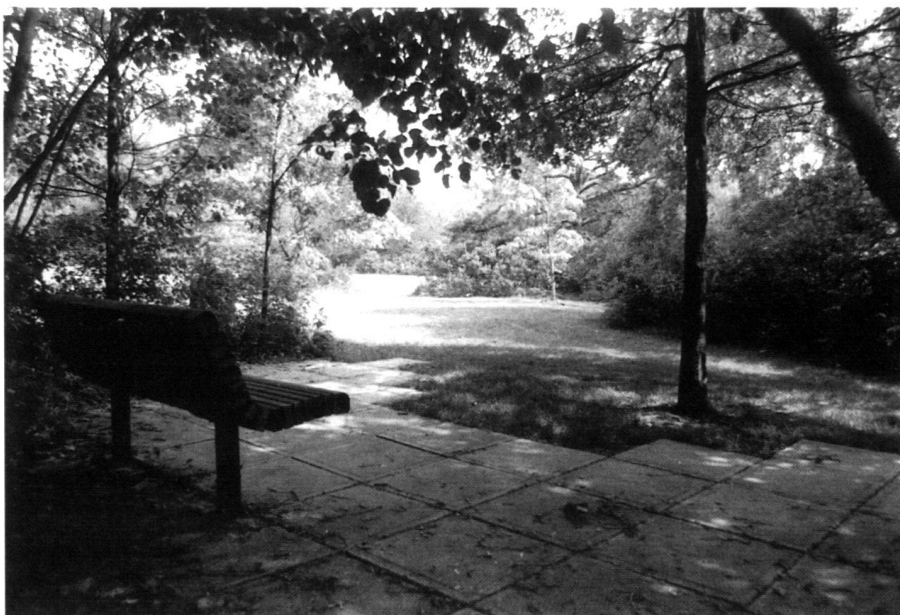
Sitzplatz entlang eines Pfades gegenüber der zentralen Wiese im Lederer-Park.

Conversions of agricultural fields to a wider diversity of vegetative covers on a minimal budget is a primary goal. While considerable expenses of landscape will re-