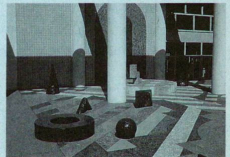
Seattle, Washington: Jailhouse Plaza, M. Schwartz, 1987.

M. S. Sehr oft werden genau die Menschen, denen es gelingt, irgendwie durchzublicken, von einem inneren «Flywheel», einem Schwungrad, angetrieben. Da ist eine kleine Maus in einem Laufrad, die einfach nicht aufhört zu rennen, und du weisst nicht, warum! Das ist nicht etwas, das man herschenken oder lehren kann. Wenn es dir gelingt, dieser kleinen Maus eine Philosophie anzuhängen, wenn du ihre Richtung und einen Sinn geben kannst, der sie mit einer übergeordneten Idee verbindet, dann bringt dich das weiter. «Ich liebe es einfach, Plastiklandschaften zu bauen. Ich liebe es einfach, die Leute zu ärgern, oder ich liebe einfache Kreise und Quadrate!» Das Schwungrad kann vieles zum Ziel haben. Ohne dieses kleine Schwungrad wird es schwierig. Das Schwungrad ist sehr, sehr wichtig, fundamental wichtig, um etwas zu bewegen. Es muss einen echten persönlichen Grund geben, um den Kampf aufzunehmen, um weiterzumachen.