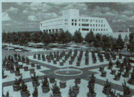
Solana, Texas: Village Center, P. Walker, 1989.

M. S. Na ja, ich komme erst seit kurzer Zeit als Professional hierher. Ich realisierte hier keine Projekte. Ich beteilige mich erst seit einiger Zeit an Wettbewerben in Zusammenarbeit mit europäischen Designern und wurde gebeten, hier Vorlesungen zu halten. Ich denke aber, dass ich Europa auf eine andere Weise wiederentdeckte, als ich es damals trampender Weise und etwas «hippie» erlebte. Ich freue mich immer sehr darauf, hierher zu kommen, um diese Dinge zu sehen, denn die Menschen sehen das Land anders, der Druck auf die Landschaft war so heftig über eine so unglaublich lange Zeit, dass es ein Amerikaner kaum verstehen kann. Trotzdem sind aus diesen Umständen