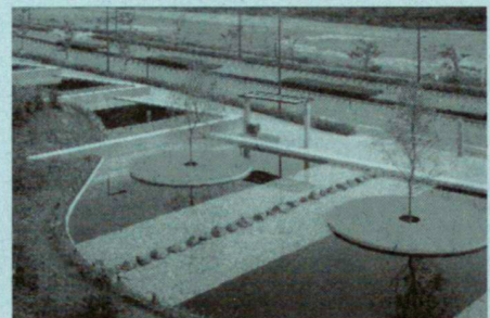
Hyogo, Japan: Center for Advanced Science & Technology, P. Walker, 1993.

M. S. Wenn wir behaupten, dass wir Gärten und vielleicht sogar neue Kunst schaffen, damit die Menschen etwas zum Diskutieren haben und so weiter, dann halte ich das schon ein wenig für eine Entschuldigung dafür, dass wir Gärten zur eigenen Befriedigung entwerfen. Das tun wir, weil unsere Profession zum Moralismus neigt. Weil wir versuchen, «das Richtige» zu tun, weil wir immer versuchen, sozial korrekt zu sein, politisch korrekt zu sein, ökologisch korrekt. Es ist sehr gefährlich, aufzustehen und zu sagen: «Ich schaffe diesen Garten, weil ich glaube, dass er wunderschön sein wird. Ich arbeite an solchen Projekten, weil ich mich dafür interessiere.» Mal ehrlich, wenn jemand es wagen würde, so zu argumentieren, würde das niemand akzeptieren. Wir lernen sogar, bloss nicht in diese Richtung zu denken. Mich interessiert es, für diese Art des Denkens wieder einen Wert zu schaffen, denn ich glaube, dass Räume, die nicht aus sehr persönlichem Interesse gestaltet werden, eher langweilige und unwichtige Räume werden. Alle Dinge, die eine Kultur auszeichnen, werden von Individuen mit eigenen kleinen Standpunkten, Gefühlen und Zielen geschaffen. Solche Dinge können in die Kultur einsickern und werden immanent. Denen, die der Ansicht sind, dass Landschaftsarchitekten nicht dieses Recht hätten, sage ich: «Schau her, ich liebe einfache Kreise, aber ich will nicht die ganze Welt zu Kreisen bekehren.» Wir haben den Eindruck, dass es wirklich schwer ist, der Profession das beizubringen.