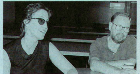
Martha Schwartz und Peter Walker beim Interview.

Peter Walker und Martha Schwartz zählen derzeit in Europa sicherlich zu den bekanntesten Vertretern amerikanischer Landschaftsarchitektur. Ihr eigenwilliges Landschaftsdesign ruft immer wieder kontroverse Diskussionen in der Fachwelt hervor. Am Ende dieser Diskussionen steht meist die Überzeugung, dass diese Art der aktuellen Gartenkunst nur in den USA zu realisieren sei, während die europäische Kulturlandschaft ganz andere Herangehensweisen verlangt. Nach erfolgreichen Projekten in Japan und Korea beginnt Peter Walker nun mit der Realisierung der ersten Aufträge in Deutschland. Martha Schwartz wird derweil immer häufiger zu Vorträgen und Workshops eingeladen, denn man erwartet von ihr richtungsweisende Impulse für die aktuelle Gartenkunst.