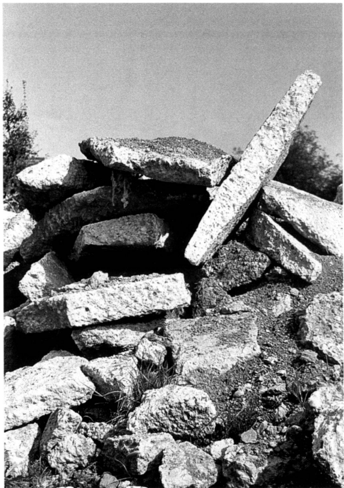
Left: Recycling: used construction material, timber, stones and a disused construction machine have found a new use in this playground. The wild greenery, the campfire site and an uncovered spring harmonise the arrangement.