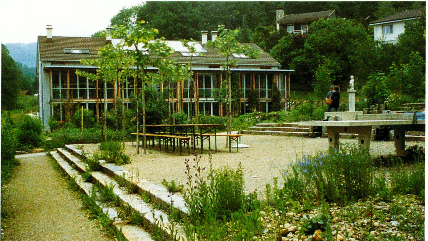
Die Reihenhaussiedlung «Wohnen und Arbeiten Wald» (WAW) der Architekten P. & B. Weber, Wald, weist gute baubiologische Qualitäten auf (u. a. Gewinner des SIA-Energiepreises 1992). Die Umgebung wurde zusammen mit den Bewohnern geplant und auch ausgeführt. Das Bild zeigt den zentralen halböffentlichen Platz mit angrenzenden Privatgärten. Landschaftsarchitekt A. Winkler, Wängi.

Good solutions from a horticultural biological point of view can succeed if one links together what is often separated: technical function, utilisation, nature and design. How inspiring, for example, is the open drainage system of the historical city of Freiburg im Breisgau. Our new Water Conservation Act, which prescribes water retention and seepage, offers similar challenges for the designer: instead of ritually washing unpolluted waste water, such as the water flowing off roads, roofs, from fountains and seepage, in treatment plants, water can become a design topic. Natural ponds for playing, marshes and ditches, or short stretches of streams are created. Water and its properties are taken as a theme. Even in the smallest stretches of water or seepage areas, the designing strength of water in erosion or accumulation forms, or mud crack soils become understandable and capable of