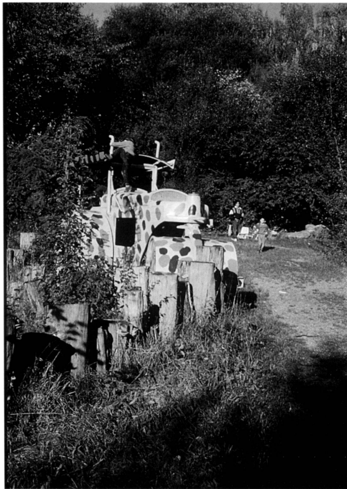
Links: Recycling: Gebrauchtes Baumaterial, Holz, Steine und eine ausrangierte Baumaschine werden auf diesem Spielplatz wiederverwendet. Dazu passen das wilde Grün, die Feuerstelle und eine offengelegte Quelle.