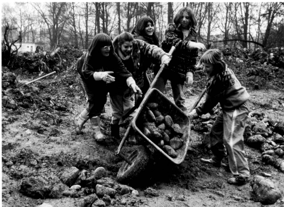
Natur zum Anfassen: Schülerinnen schütten die gesammelten Steine zu einem Haufen auf (Naturhaus Allmend).

Quite apart from the fact that in Zurich there is also much «classical» nature: After all one quarter of the city area is forest, there is a fen of national importance within the city boundaries, the «Inventory of communal protected items of nature and