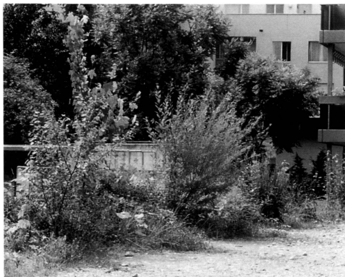
Unversiegelte Flächen – Grundvoraussetzung für Stadtnatur.

Successes in nature conservation? Our tactic is the one of small but persistent steps. Here we will certainly record numerous successes. Where does being successful begin? For me already in that moment when an architect pronounces the term "ruderal area" without faltering – in the ambiguous sense.