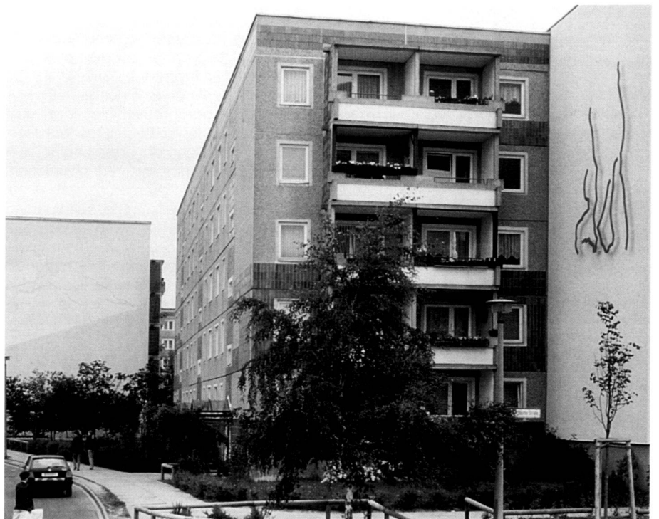
Künstlergiebel, Neudefinition eines öffentlichen Raumes, Künstler Klaus Schmidt.

Steel sculpture «The Draughtsman» at a central point of access to Berlin-Hellersdorf, artist Frank Dornseif, Berlin.