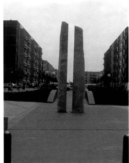
Realisierter Stadtplatz Leipziger Tor, Landschaftsarchitekten Glasser und Dagenbach.

Draft design for the urban square Leipzig Tor in Berlin-Hellersdorf, image of nature.