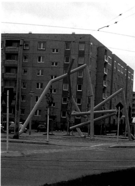
Stahlskulptur «Der Zeichner» an einem zentralen Stadteingang von Berlin-Hellersdorf, Künstler Frank Dornseif, Berlin.

The requirements for open space developments in the large estates are high and of long-term significance. However, the amount of finance available for measures of all kinds for residential surroundings up to now will drop sharply in the near future. From this results the continued need to implement individual measures, in the short term under great pressure of time. The inclusion of these many and varied immediate measures into strategies, which are often only at their initial stage, will remain a particular challenge in everyday planning life.