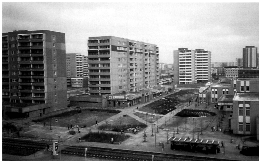
Städtebauliche Grossstruktur, Zentrum Berlin-Hohenschönhausen. Fotos: Planergemeinschaft Dubach und Kohlbrenner

With the social transformations, everyday life also changes. The period of time which residents spend in the estates increases. The need for a good quality place of residence offering opportunities