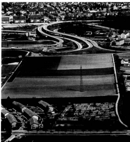
Stettbacherwiese, 1984 und 1989.

Within the scope of the feasible, the concept respects the existing landscape character of the plain, i. e. the existing plain is