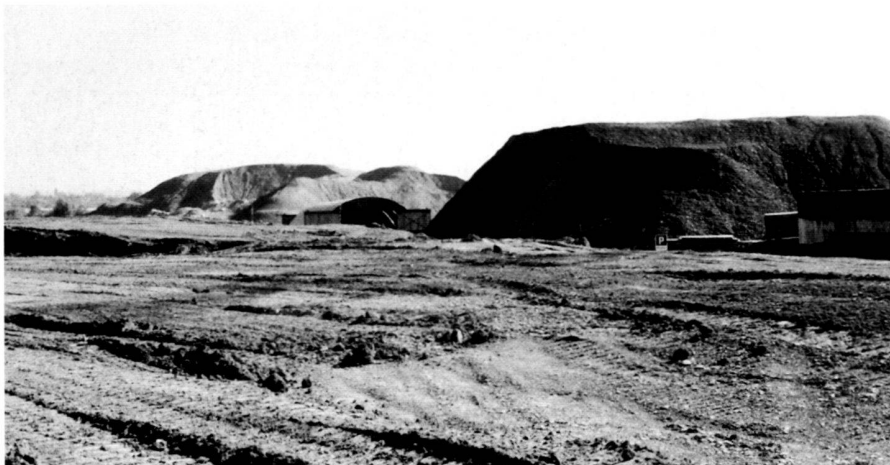
Bauphase etwa 1987. Etape de construction, en 1987 env. Construction phase ca. 1987.

Geobotanists thought they recognised a similarity (unintended by the planners) with an ice-age terminal moraine in the relief