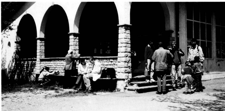
Im Mai 1995 befragten Studierende der Universität Basel 622 Besucherinnen und Besucher im Jura zum Thema Natur- und Landschaftsschutz.

Asked about their payment motivation, the two random samples hardly differed. The majority argued that the Jura must be