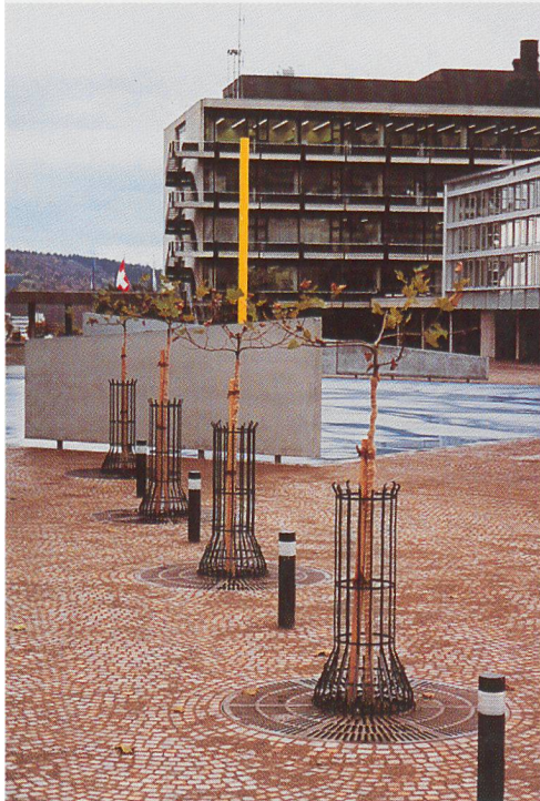
Irchel Universität, Zürich

BUDERUS Baumroste und FEHR Baumschutzgitter bilden eine starke Einheit. Hier einige Beispiele von gelungenen Objekten der letzten Zeit: