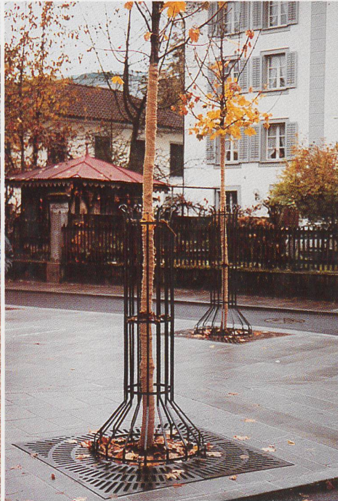
Dorfzentrum in Sarnen