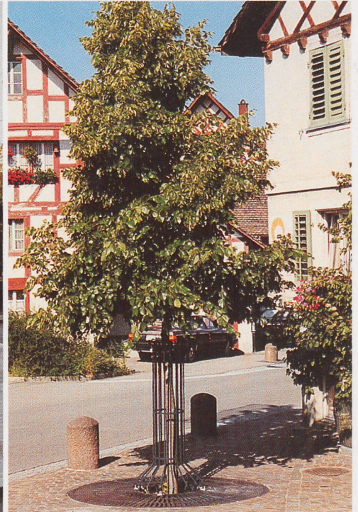
Eine Idylle in Uitikon

Verlangen Sie eine persönliche Beratung oder Unterlagen