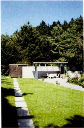
Die «Black Box» am Waldrand.

Das Wohnzimmer öffnet sich durch das grosse Fenster zum weiten Garten. Der hausnahe Betonplattenbelag bringt das Wohnen jetzt nach draussen. Der Sitzplatz liegt vertieft und ist intim. Geländestufen, mit Buchs vorgepflanzt, führen zum erweiterten und noch verborgenen Gartenraum. Seitlich stehen neu zwei verschoebene, gestufte Betonmauern. Sie geben Geborgenheit und etwas Schutz vor Wind und Strassenlärm. Davor steht die alte Föhre, von gelb blühenden Waldreben und grünem Efeu überwuchert. Die Schrittplatten führen durch die rot und weiss blühenden Stauden und die grün abgestufte Blattvegetation zum Pavillon. Die leichte Holz-, Glas- und Stahlkonstruktion ist von Hopfen umrankt. Von hier kann der Blick über das Staudenbeet schweifen. Die Stauden wachsen dort kontrolliert, gefasst von einem Band aus Metall. Das Blumenbild spielt mit den Farben Rot, Gelb und Blau, punktiert mit Grün und Grau. Die lange, leicht gebogene Beetform weist auf den alten Birnbaum in Nachbars Garten.