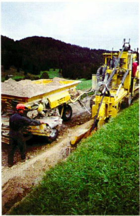
Verlegung der 20-kV-Leitungen im Naturpark Jura in Frankreich.

Den potentiellen Auswirkungen der Freileitungen auf naturnahe Landschaften wird immer mehr Bedeutung beigemessen. Dabei geht es nicht nur um visuelle Probleme (siehe dazu auch den Artikel «Hochspannung» in diesem anthos). Bereits beim Bau der Leitungen können Landschaften durch die Zerstörung seltener Biotope beeinträchtigt werden. Deshalb werden heute die Standorte von Strommasten sorgfältiger ausgewählt als früher. Elektrische Leitungen bergen aber auch ein beträchtliches Todesrisiko für die Vogelwelt, und zwar einerseits durch Stromschlag, vor allem für grosse Vogelarten wie Raubvögel und Störche, andererseits aufgrund von Kollisionen mit den Leitungen während des Fluges. Die Hersteller versuchen seit langem, durch eine entsprechende Gestaltung der Masten das Stromschlagrisiko zu mindern. Zu diesem Thema sind Empfehlungen auf Bundesebene in Vorbereitung. Die Wahl der richtigen Leitungsführung bleibt wesentlich, wenn für den Vogelschutz wichtige Gebiete geschont werden sollen.