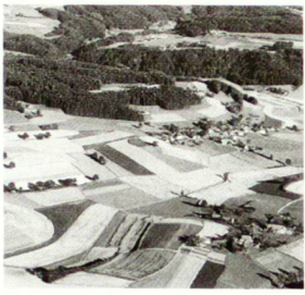
Photographie aérienne du site de Bärswil