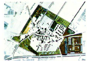
Ankauf Wettbewerb Hirschstettner Gründe: Projekt von Raderschall Landschaftsarchitekten AG, Meilen.