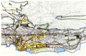
Objectif d'aménagement et plan directeur: «Neuchâtel et sa qualité spatiale»

Le jury de l'ASPAN s'était donné les critères suivants: