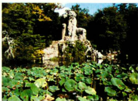
Le célèbre «Apennin» de Giambologna au parc de Pratolino, Florence.