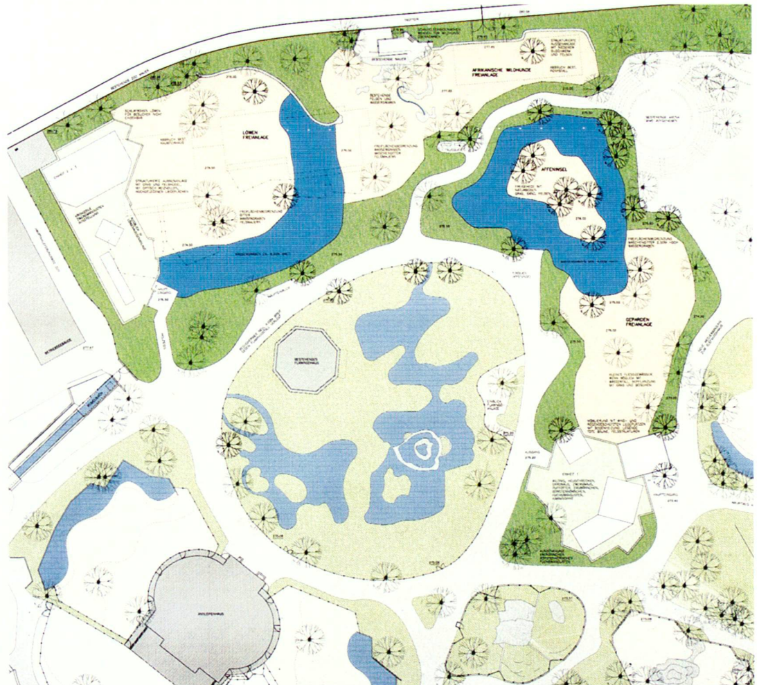
Planausschnitt mit neuer Beutegreiferanlage (oben) und Flamingoanlage (mitte).

Le grand intérêt du lieu vient de l'impression que l'on a de se trouver tout près des animaux: le bassin d'eau pour les hippopotames fait en même temps office de barrière naturelle, composée avec des éléments qui s'intègrent parfaitement dans le paysage. Grâce à la déclivité naturelle du terrain à la périphérie du complexe, les étables se dérobent au regard du visiteur.