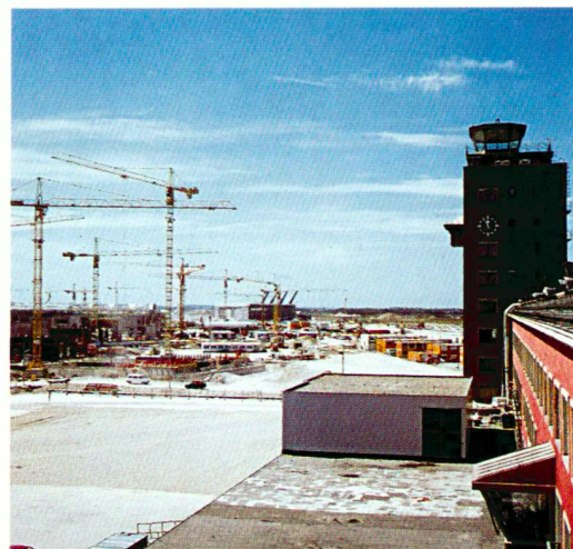
Blick von Süden