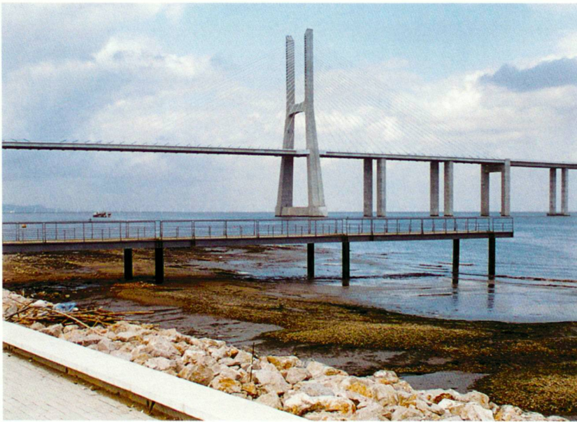
Tejo-Ufer/Vasco-da-Gama-Brücke, Ufersicherung mit Blockwurf